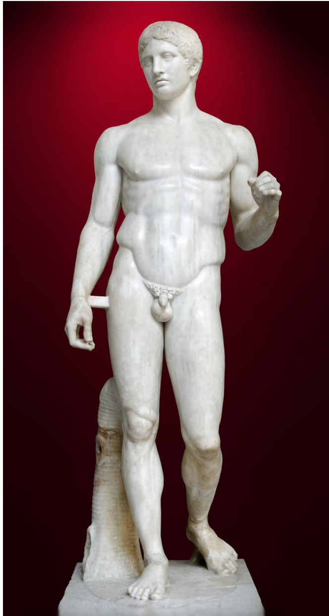
Figura 1 – Doríforo, de Policleto