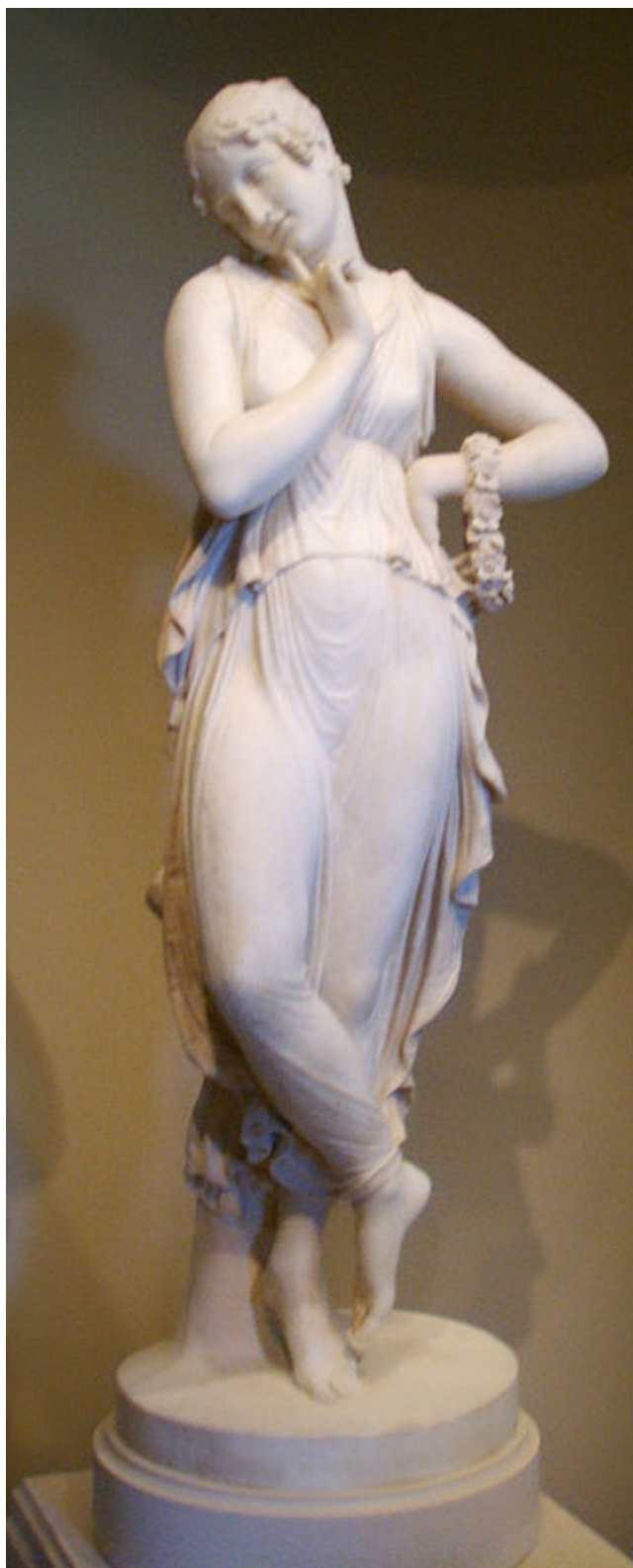
Figura 3 – Ballerina, de Antonio Canova