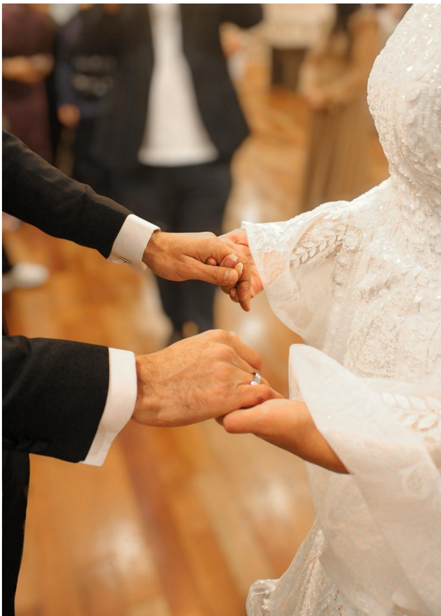
O casal dá as mãos após a troca de alianças na cerimônia de casamento.