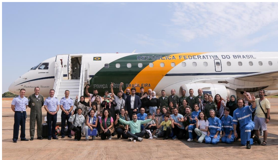
Grupo de repatriados em Brasília, antes da decolagem até a Base Aérea de São Paulo.

A diplomacia brasileira apresentou uma lista solicitando o resgate de 102 pessoas para liberação na segunda lista de repatriação. O pedido registrou uma considerável mudança nos critérios brasileiros para repatriação, que agora incluía, com o aval de Mauro Vieira e Lula, irmãos e avós.