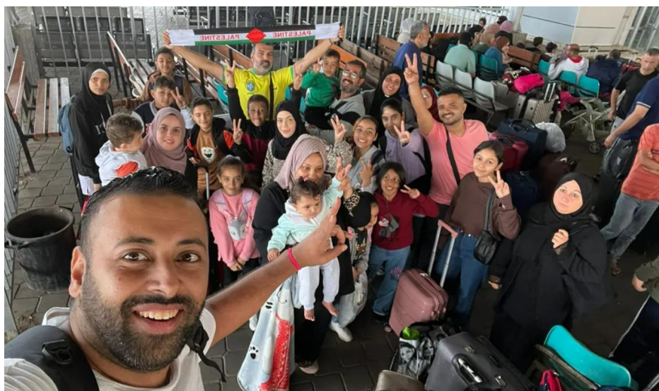
Hasan Rabee fotografa parte do grupo de brasileiros e familiares em um posto de imigração em Rafah, no dia 12 de novembro de 2023, um dia antes de serem repatriados