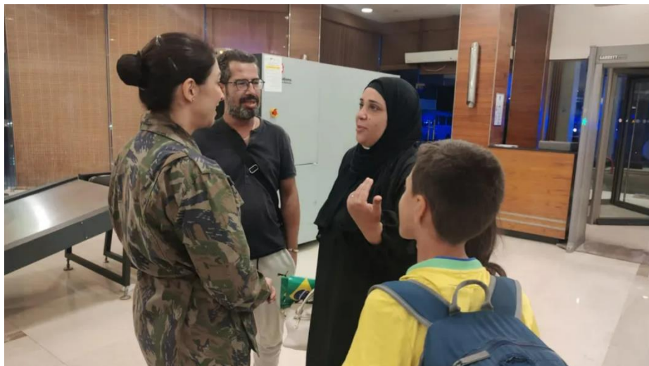
Família Bader conversa com psicóloga da FAB no Cairo.

tratamento foram surpreendentes; a gente estava com o coronel e com a equipe da embaixada, uma alegria muito grande. Mas, ao mesmo tempo, a gente deixou familiares lá [em Gaza]. Tanto que a gente estava feliz e, no mesmo dia, a gente estava triste."