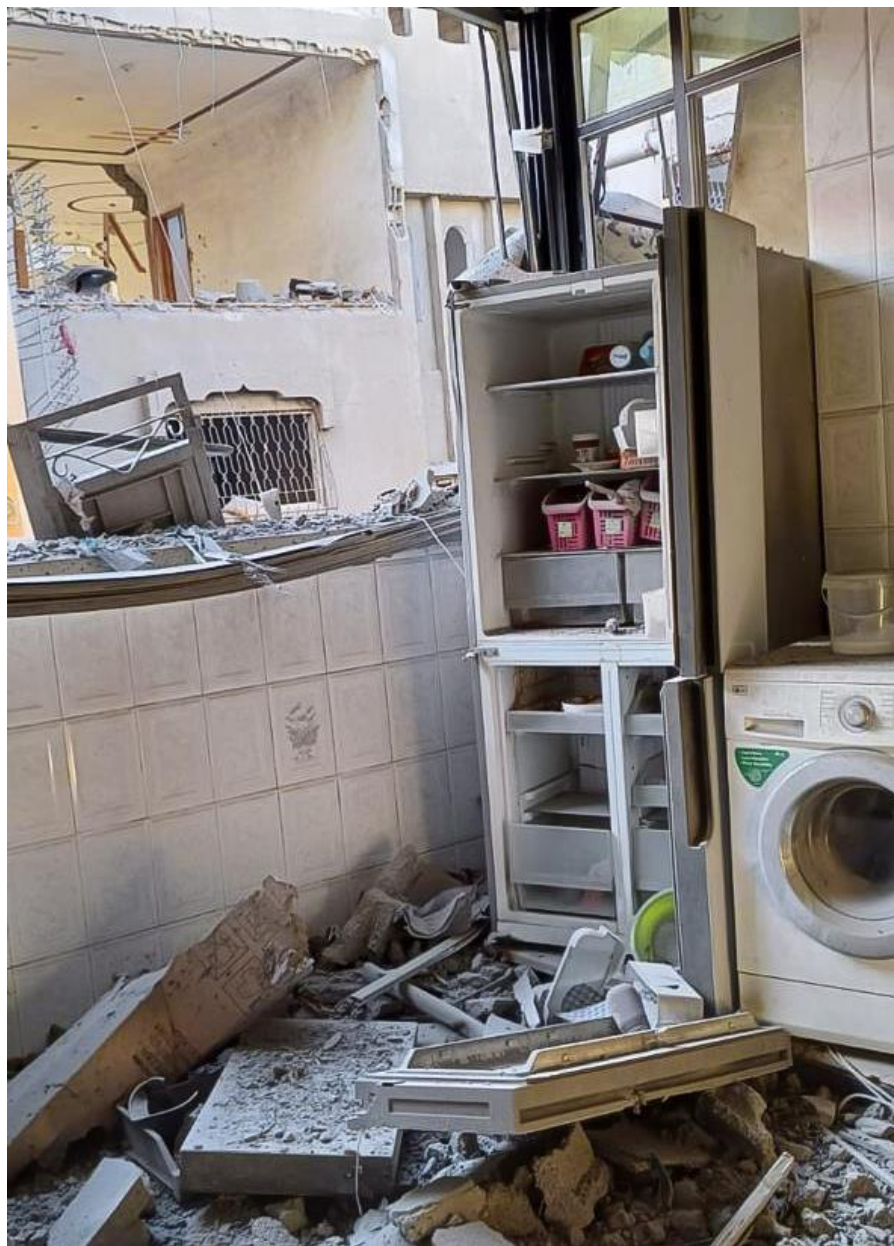
Casa de Noura Bader após bombardeio de Israel na Faixa de Gaza.