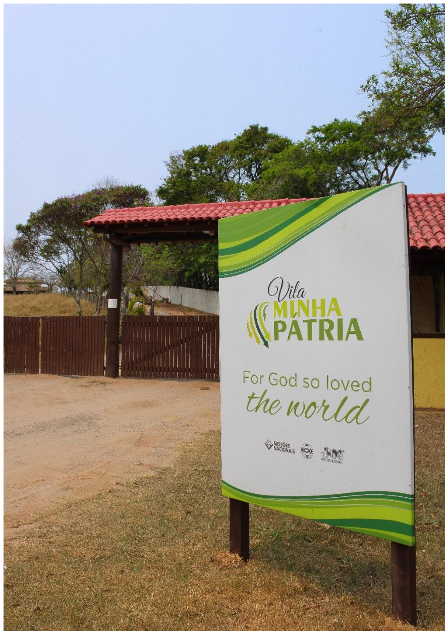
Porteira da Vila Minha Pátria, em Morungaba, interior de São Paulo.