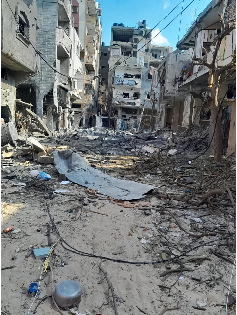
Bairro em Jabalia destruído por bombardeios israelenses.