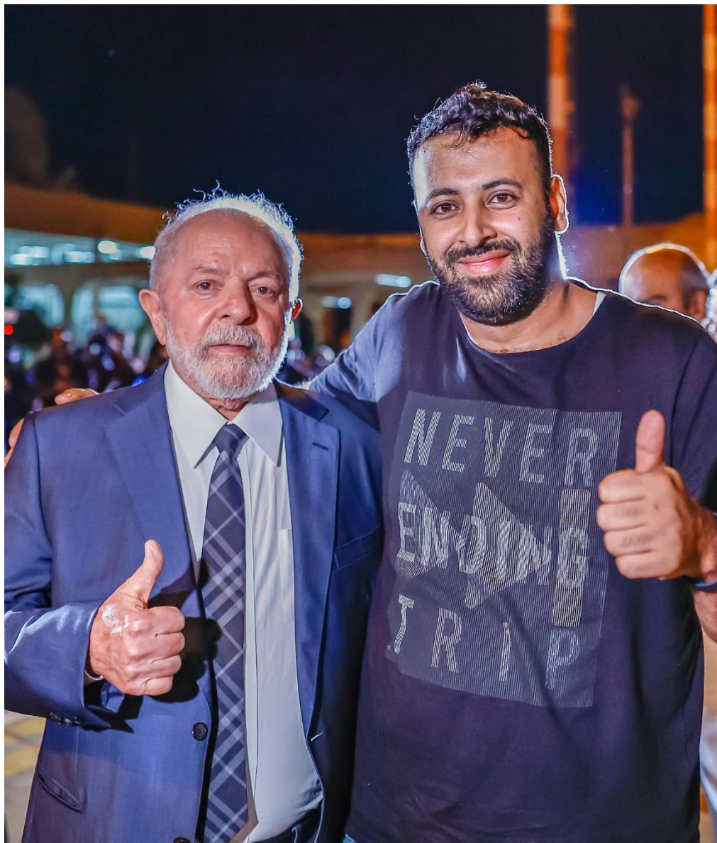
Presidente Lula e o agora repatriado Hasan Rabee