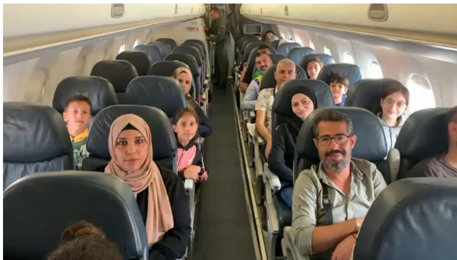
Brasileiros e familiares antes da decolagem do avião presidencial no Cairo.

O grupo seguiu viagem por terra dividido em vans até o Cairo, em um percurso que leva cerca de seis horas. Na capital egípcia, os brasileiros e seus familiares receberam atendimento médico, se alimentaram e se hospedaram para se prepararem para uma viagem de quase 17 horas até o Brasil, prevista para a próxima manhã.