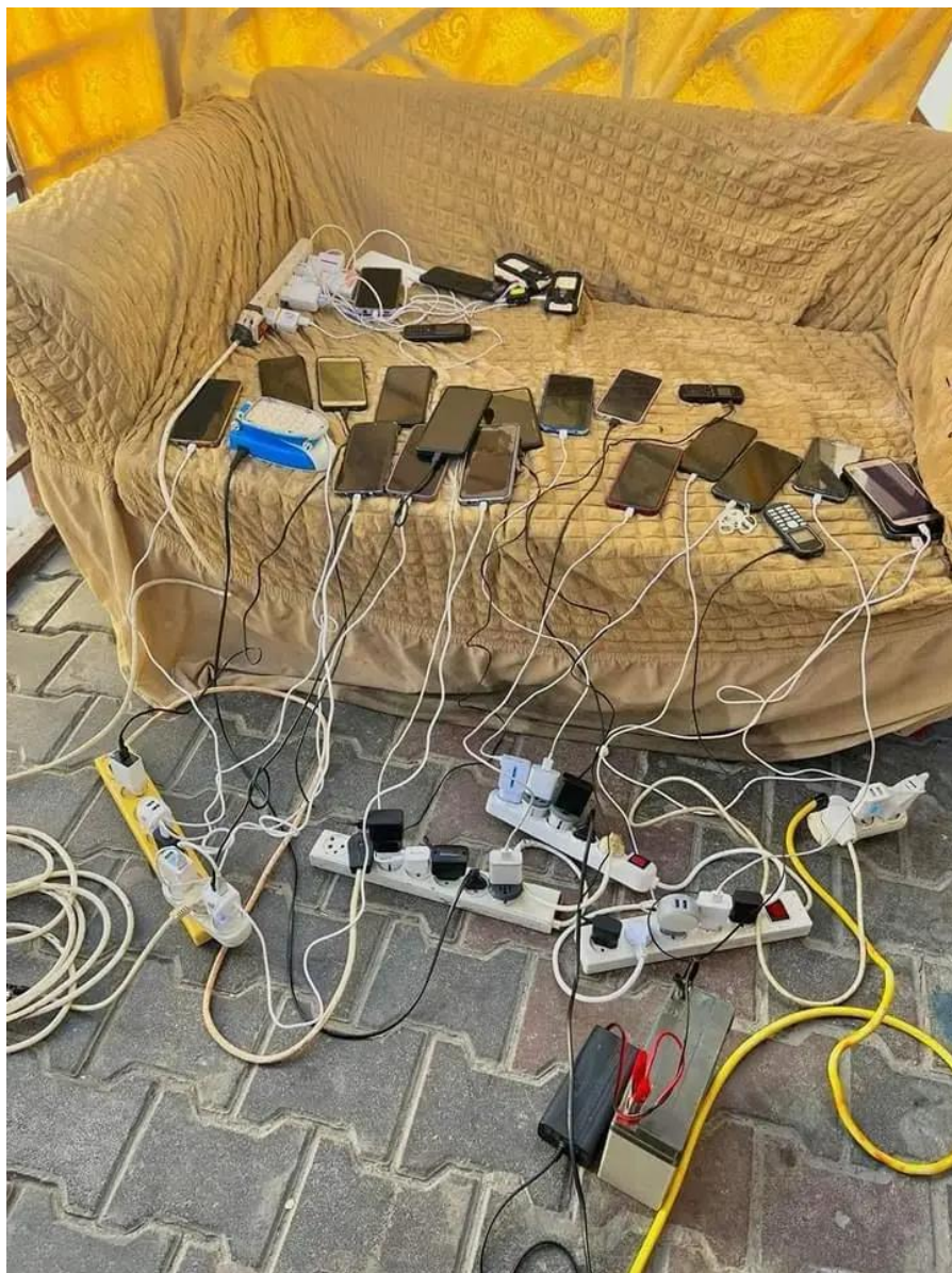
Celulares são carregados aos montes em Gaza com auxílio de energia solar.