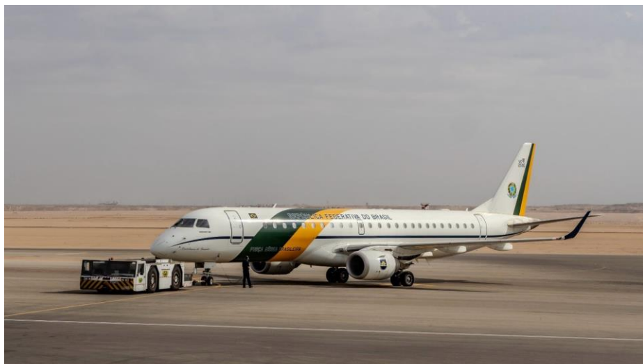
Aeronave VC-2, cedida pela Presidência da República, aguarda na capital egípcia do Cairo, em 31 outubro de 2023, a liberação da fronteira para que os brasileiros possam embarcar.