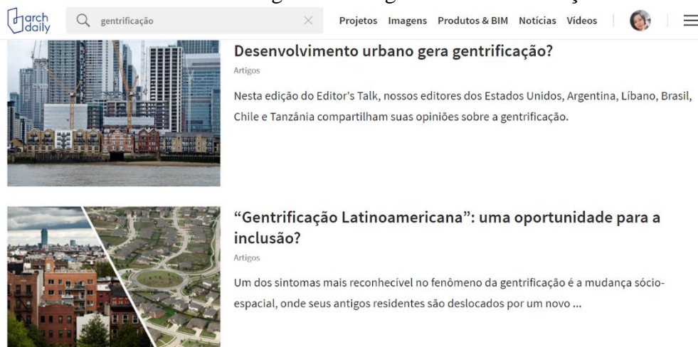
Figura 1 - Artigos sobre Gentrificação

E é claro que com o passar dos anos, o processo também foi mudando e de certa forma crescendo mais ou menos como na mesma medida que o neoliberalismo foi avançando sobre a economia. E se um dia, o que foi uma determinada “anomalia” isolada do pós-guerra em apenas um recorte sobre a realidade local de uma única cidade na Europa, hoje já é algo bem maior e abrangente. Nos últimos anos, a gentrificação deixou de ser um assunto “estritamente acadêmico” para se tornar manchete jornalística e tema de discussões informativas e de curiosidades na internet.