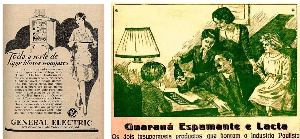
Figura 5 - Anúncios anos 20

Começando pelos anos 20, não nos surpreendemos ao notarmos que a maior parte das peças publicitárias protagonizadas por mulheres era de aparatos domésticos e, em se tratando de produtos diversos, quando essas apareciam em algum outro ambiente costumavam estar inseridas em um contexto familiar, cercadas de filhos ou acompanhada do marido.