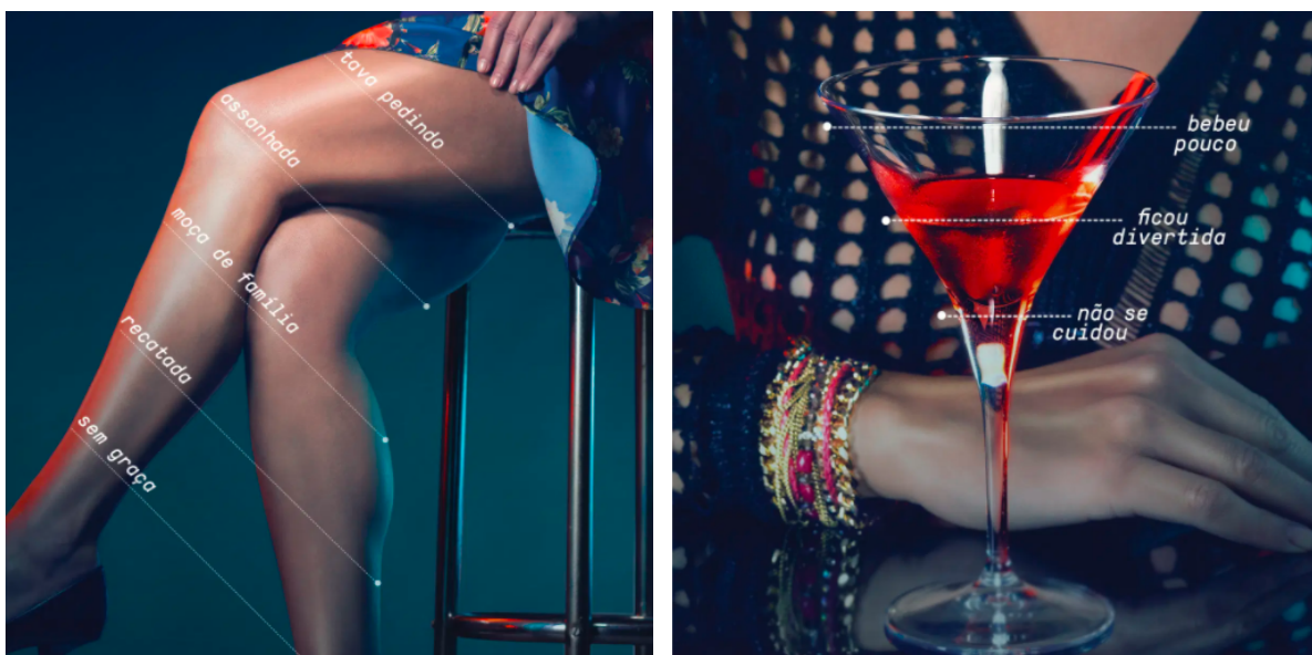
Figura 1 - Como silenciamos o estupro