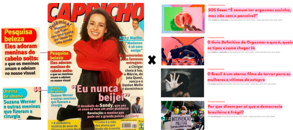
Figura 3 - Capricho 1999 x Capricho online 2021

Comparação entre as manchetes da edição de 99 e algumas recentes disponíveis no site da revista.