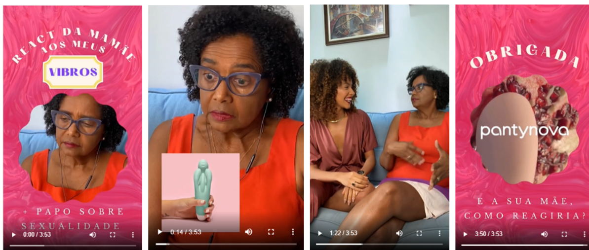
Figura 14 - Frames do vídeo “React da mamãe aos meus vibros”