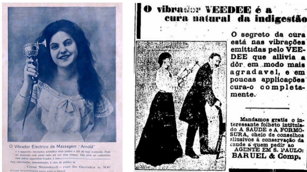
Figura 10 - Anúncios de vibradores (1909 e 1912)

em formatos, cores e materiais mais apazíveis à anatomia feminina, mas, ainda assim, há registros de marcas famosas que seguiram não admitindo sua utilidade principal até poucos anos atrás (idem, p. 393-394).