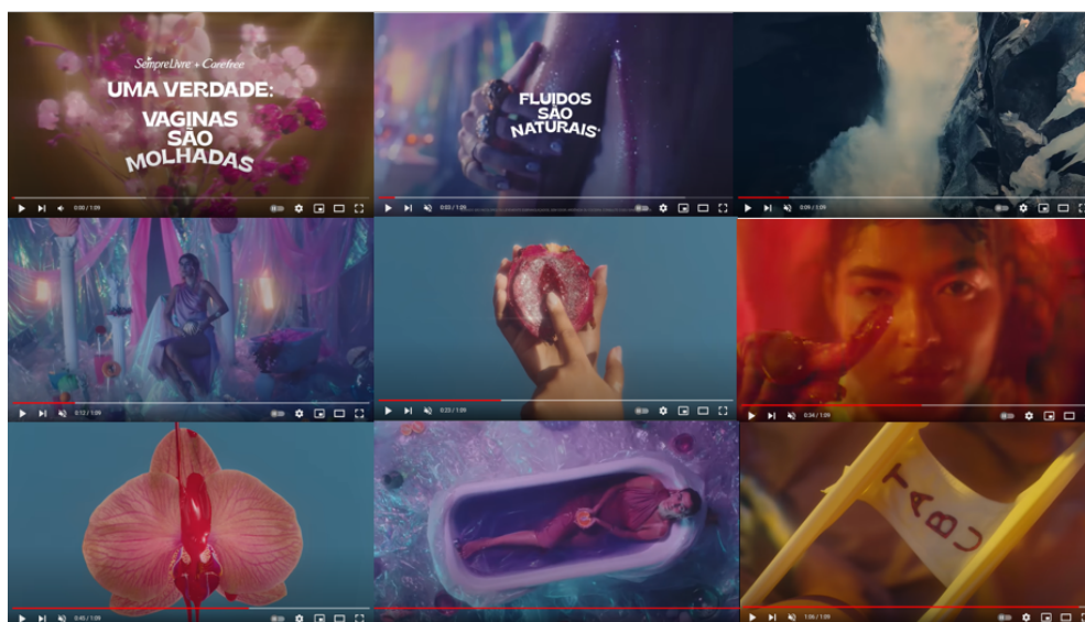
Figura 9 - Frames do filme #DeixaFluir (2021)