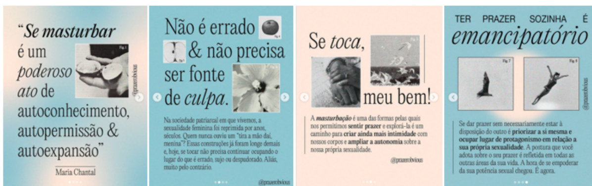
Figura 4 - Publicação da @prazerobvious

com uma linguagem leve e de fácil entendimento, procura reunir história, ciência, psicanálise, conhecimento empírico e humor internético para promover a libertação da sexualidade feminina por meio da busca pelo prazer sem censura.