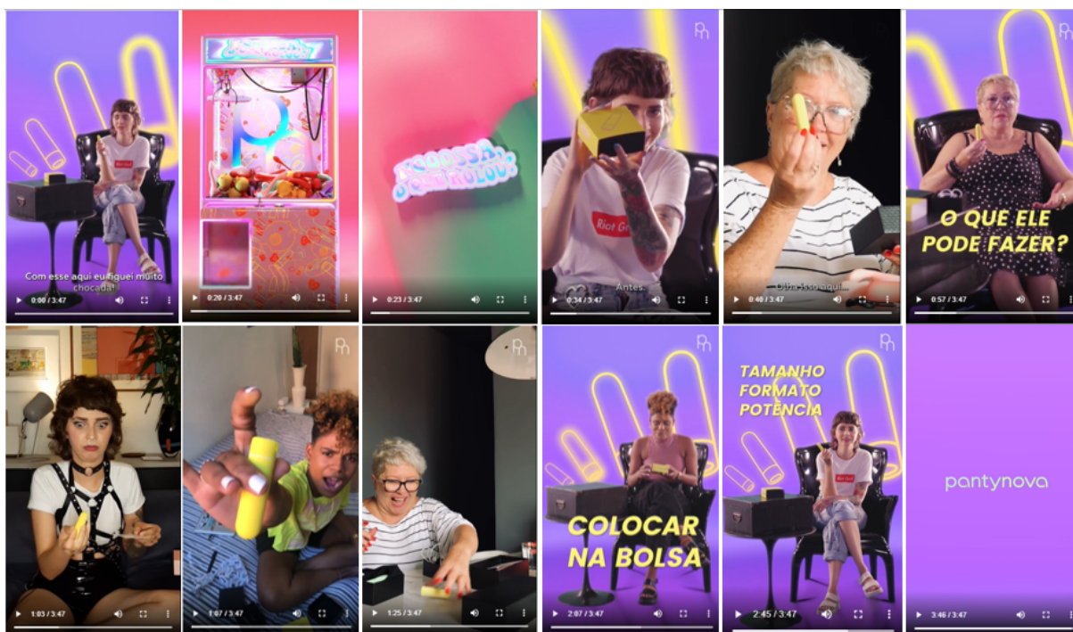
Figura 13 - Frames do vídeo Nooossa o que rolou?