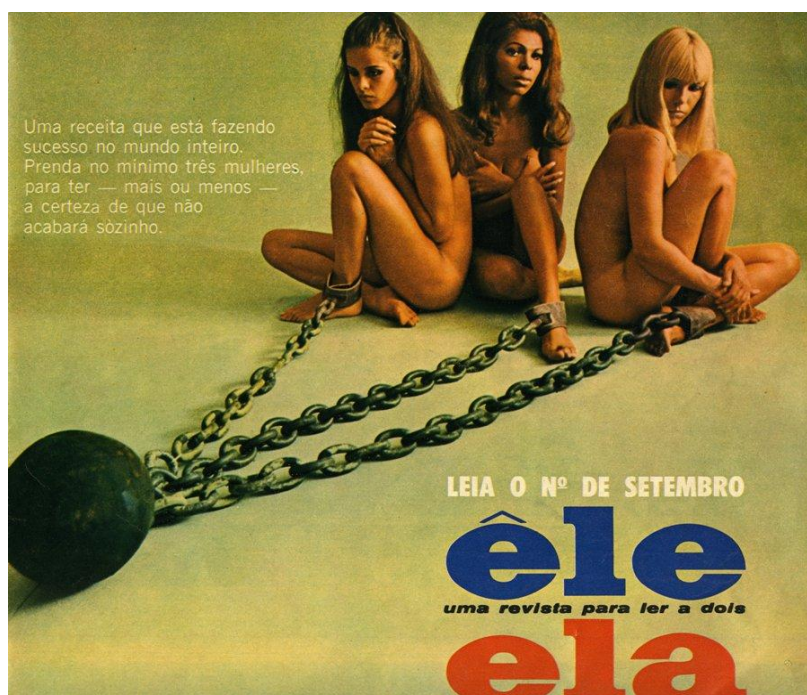
Figura 2 - Anúncio da revista Ele e Ela

A despeito do mote da publicação ser “uma revista para ler a dois”, o anúncio é direcionado ao público masculino e explicita a visão machista que guiava seu conteúdo que mais servia à doutrinação da mulher a serviço do homem.