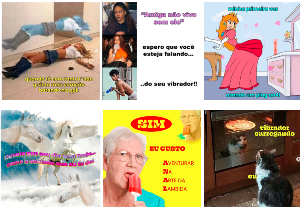
Figura 11 - Posts recentes no Instagram da Pantynova