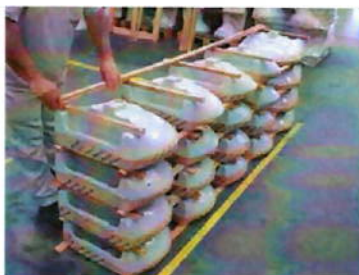
Foto 8 – Estocagem de lavatórios com coluna

- Lavatórios com coluna devem obedecer o empilhamento máximo de (nove) níveis (Foto 8).