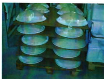
Foto 1 - Estocagem de cubas de lavatórios

As louças são materiais que requerem uma área de estocagem ampla, de preferência em um local onde as mesmas possam ficar até o momento da sua instalação, evitando transporte desnecessário dentro do canteiro e, conseqüentemente, diminuindo o risco de quebra e desperdício do material. As Fotos 1, 2 e 3 a seguir, apresentam a forma de estocagem adequada de louças em um canteiro de obras.