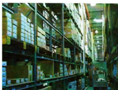
Foto 9 – Estoque de metais do centro de distribuição da empresa DECA

Metais não apresentam tantos problemas para sua estocagem por serem peças pequenas. Facilmente podem ser erigidas prateleiras dentro de almoxarifados, no canteiro de obras, e nas mesmas serem estocadas todas as peças, como mostra a Foto 9, do estoque de metais do centro de distribuição da empresa DECA em Jundiaí.