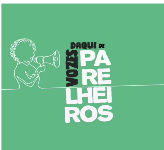
Figura 3 - Logo do Vozes Daqui de Parelheiros aplicado em fundo colorido