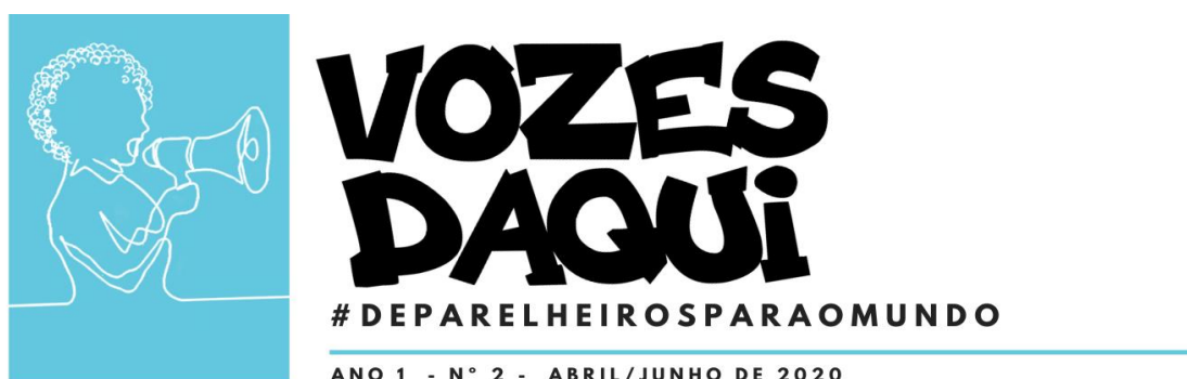
Figura 4 - Capa da 2ª edição do jornal digital Vozes Daqui: de Parelheiros para o mundo