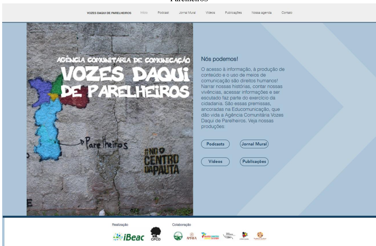
Figura 2 - Print da homepage do site da Agência de Comunicação Comunitária Vozes Daqui de Parelheiros

Para a concentração de todos os conteúdos produzidos pela Agência de Comunicação Comunitária Vozes Daqui de Parelheiros , foi criado um site que reúne os podcasts , o jornal digital, futuras publicações, futuras produções audiovisuais e agenda (Figura 2).