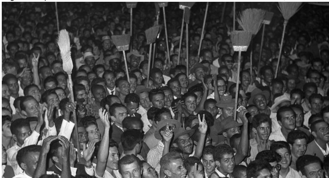
Figura 7 - Apoiadores de Jânio levantam vassouras em comício na Cidade Livre, em Brasília

Logo percebe-se que tais evocações metafóricas, nesta disputa pela presidência, assumiram papel central e inédito na história da República. Enquanto anteriormente os esforços de comunicação, as produções e as peças evoluíam com um crescente apelo à exaltação de pontos positivos de candidatos, voltando-se a características de gestão, inteligência, habilidades e até de aproximação do povo - como o caso de Getúlio tornando-se Gegê e de JK sendo visto como o grande fazedor de obras -, a partir de Jânio atributos de outras esferas da vida social passam a ser possibilidades e matéria para a política. Na era da comunicação de massas, não bastava um programa bem formulado em um panfleto, era necessário atrair as disputadas atenções através de mecanismos novos e diversos.