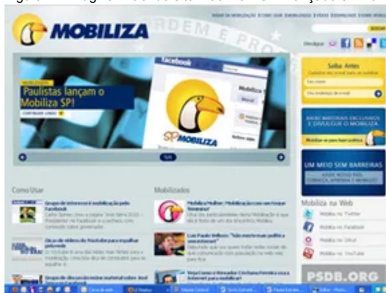
Figura 12 - Página inicial do site Mobiliza PSDB lançado em 2010

Como exemplos concretos das empreitadas iniciadas em 2010 no Brasil estão o site de pré-campanha “Mobiliza PSDB” lançado pelo partido de José Serra e através do que era ensinado o básico das redes e dicas de como o simpatizante e militante poderiam utilizar o Twitter, blogs, Orkut, Facebook, YouTube e até como melhorar os resultados em buscas feitas no Google em prol da candidatura do presidenciável, uma espécie de “Meu Barack Obama”.