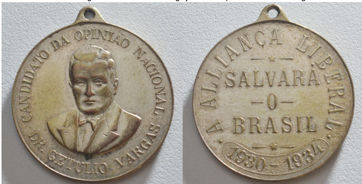
Figura 1: Medalha de divulgação da campanha de Getúlio Vargas