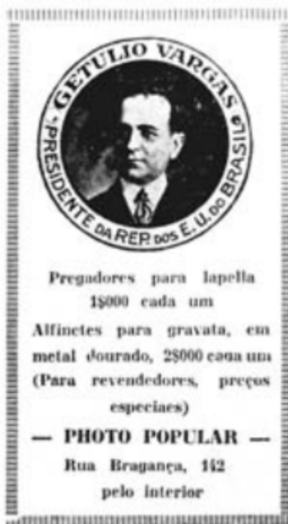
Figura 2: Anúncio de pregadores para lapela com a imagem de Vargas