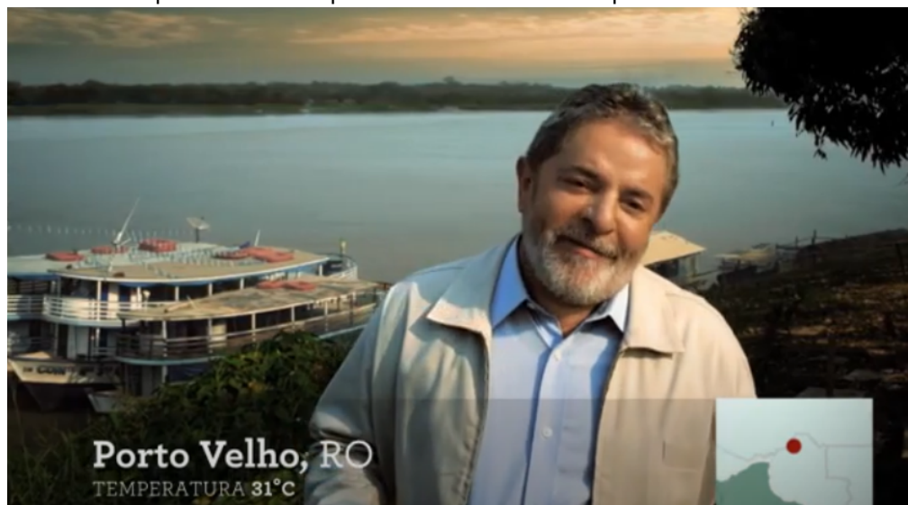
Figura 9 - Em Porto Velho e à distância, Lula interage com Dilma, sua indicada à sucessão presidencial no primeiro comercial de campanha.