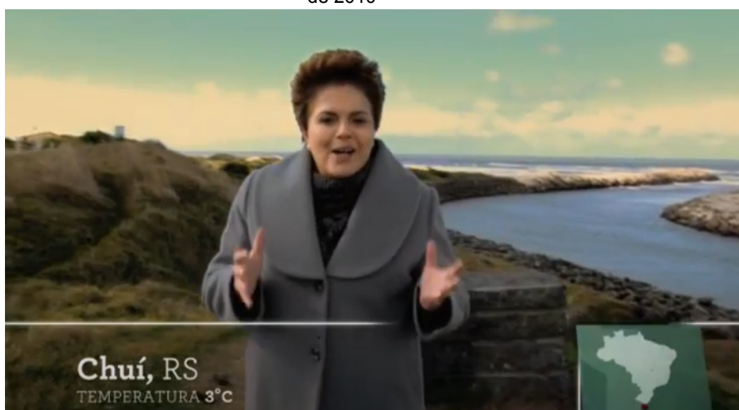
Figura 8 - Primeira cena em que a candidata Dilma Rousseff aparece no programa eleitoral de 2010

Como caso concreto que também exemplifica este cenário de produções complexas, caras e profissionalizadas menciona-se a campanha presidencial da candidata Dilma Rousseff, do PT, à Presidência da República. Com o apadrinhamento do então presidente Lula e estando João Santana no comando da comunicação político-eleitoral, a aparição pessoal dos dois políticos petistas no primeiro comercial para a televisão produzido para o primeiro turno da eleições mostra Dilma arroio do Chuí, localizado na gaúcha tida como o ponto mais ao sul do Brasil, intercalada pela presença e falas de Lula em Porto Velho, no extremo-norte brasileiro, em uma conversa revezada entre ambos sobre um futuro prometido. A conversa separada por milhares de quilômetros e que exhibe primazia técnica e visual, com ótima captação de som e atenção mínima aos detalhes dura menos de dois minutos, mas os gastos envolvidos foram bem maiores.