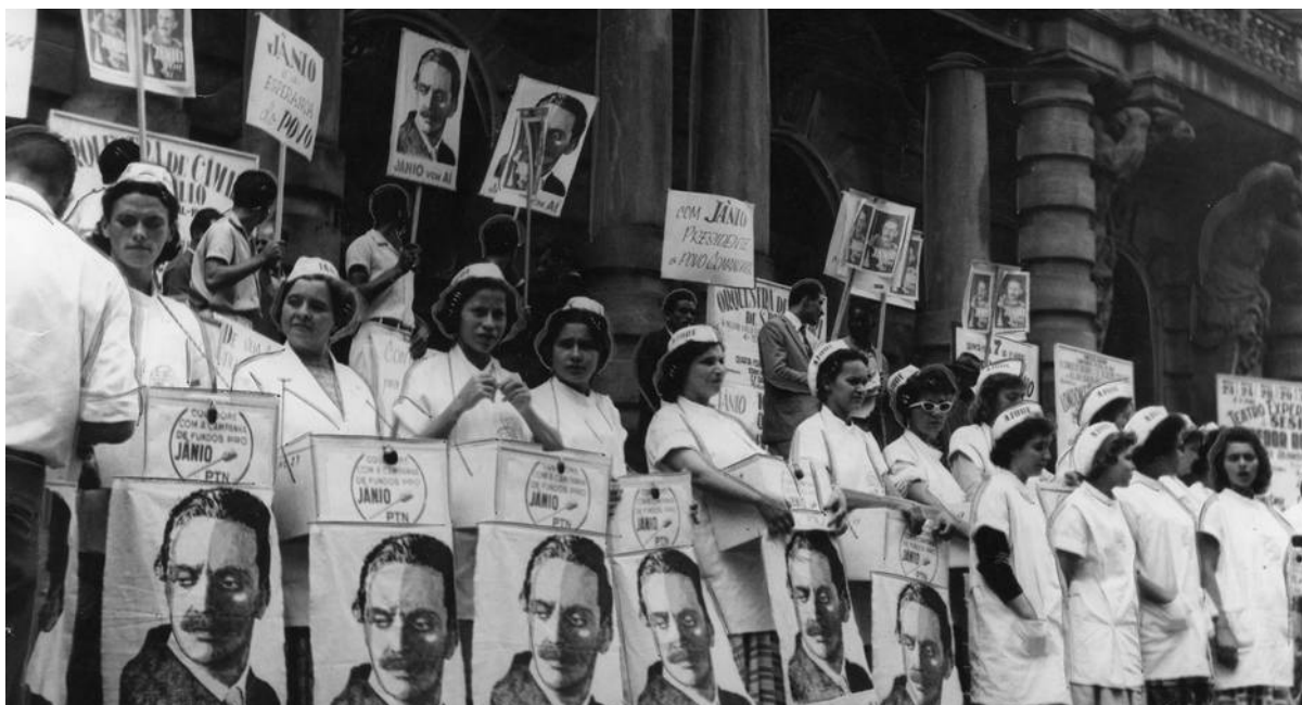
Figura 6 - Mulheres exibem cartazes com ilustrações de vassouras na escadaria do Teatro Municipal de São Paulo

Materiais eleitorais como santinhos, selos, broches, cartazes, panfletos, ofícios, cartilhas eleitorais e flâmulas, mais uma vez marcaram presença publicitária na campanha - o que reforça o papel dos objetos e da cultura material como componentes de entendimento histórico e social - estampando o rosto de Quadros, mas sem a presença de um plano ou projeto de governo, como fora feito por JK quando concorrera, apenas suas frases de efeito e ilustrações da clássica vassourinha acompanhavam sua face impressa. Frases e ilustrações que, deve-se ressaltar, simbolizava a promessa do candidato de varrer a corrupção do governo e que se tornou presença cativa nos programas eleitorais televisivos e nos comícios, sendo as duas plataformas as mais relevantes quando se analisa os componentes propagandísticos produzidos e coordenados àquela eleição.