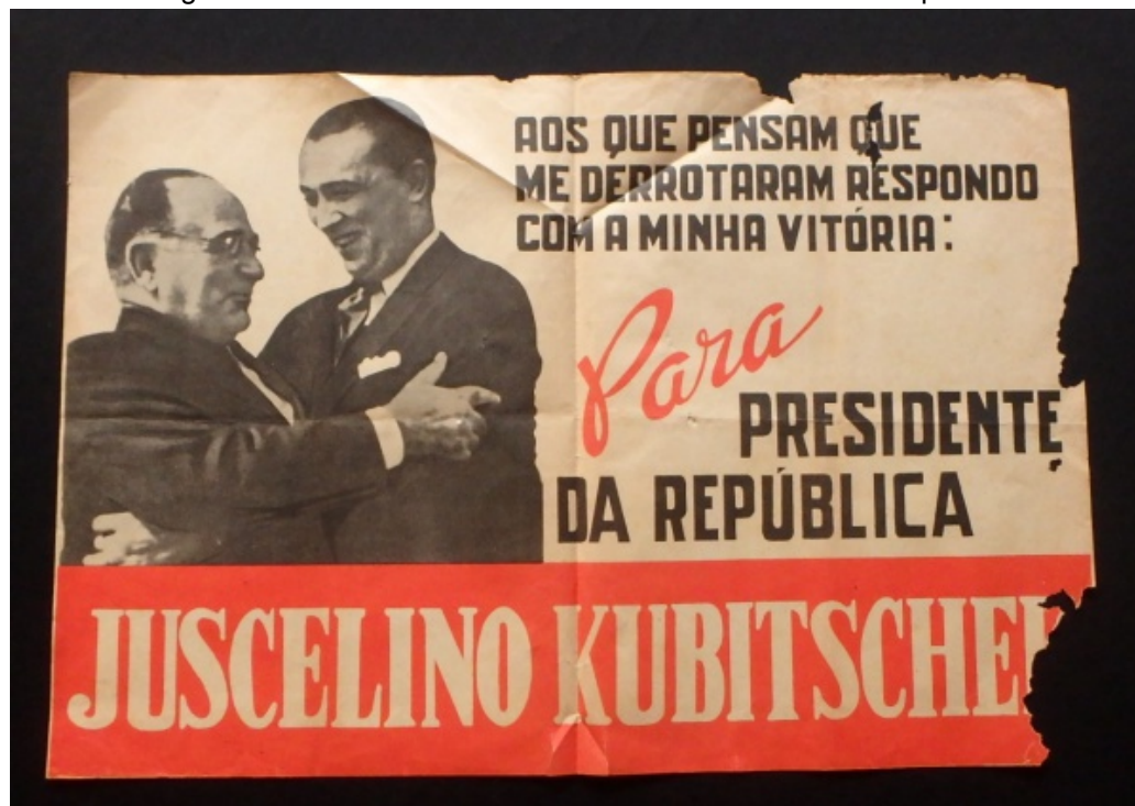
Figura 5 - Panfleto vincula Getúlio a Juscelino em sua campanha

clássico enunciado “Juscelino para Presidente”, enquanto seu programa de governo consagrou na história a promessa de progredir “50 anos em 5”, marca de seu governo até a atualidade, assim como a marcante frase “Novos rumos para o Brasil”, sintetizadoras do desenvolvimentos que ganhava força e viria a chegar ao poder.