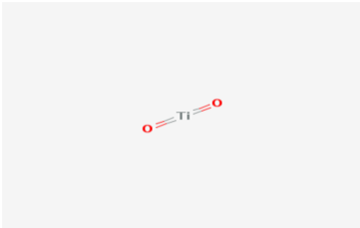
Figura 3 -Fórmula estrutural do dióxido de titânio