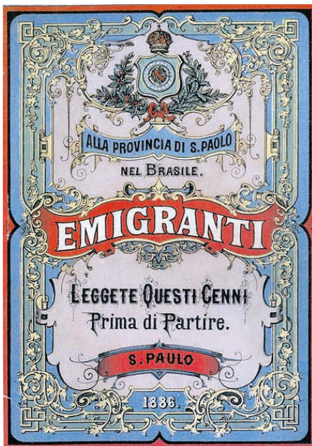
8. Manifesto da emigração italiana em São Paulo.

números menores, cidadãos italianos tenham começado a embarcar para este país, em grupos compostos principalmente por refugiados políticos dos movimentos revolucionários europeus de 1820-1821. Além desses exilados, acrescentaram-se italianos que cuidavam de terrenos de fazendeiros, da construção de estradas na cidade do Rio de Janeiro e que colaboraram na construção da primeira ferrovia brasileira que ligava a cidade a Petrópolis.