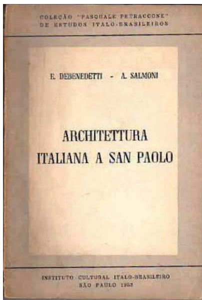
2. Architettura italiana a San Paolo. Edição 1953.

Arquitetura, uma história, duas autoras italianas em São Paulo nos anos 1950