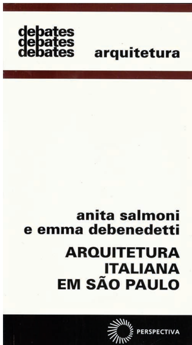
3. Arquitetura italiana em São Paulo. Edição 1981.

“O texto em italiano era muito difícil de consultar, pois estava em poucas e raras bibliotecas”. 25 A necessidade de traduzir e reeditar o livro surgiu por causa do impulso que ganhou o movimento a favor da preservação das obras arquitetônicas. De fato, a partir de 1974 foi criada uma listagem dos