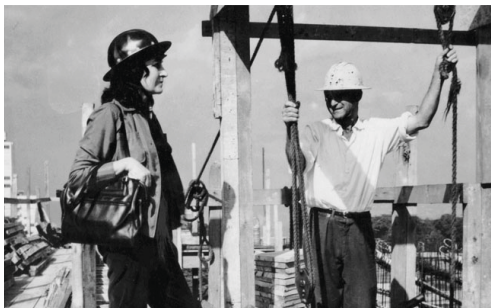
10. Lina Bo Bardi no canteiro de obras.

No campo das artes e da arquitetura no Brasil, quando se pensa a partir do ponto de vista feminista, colocam-se figuras como Carmen Portinho no Rio de Janeiro, terceira mulher formada na Faculdade de Engenharia Civil, Lina Bo Bardi e Tarsila do Amaral em São Paulo, a considerar como precursoras dos movimentos femininos.