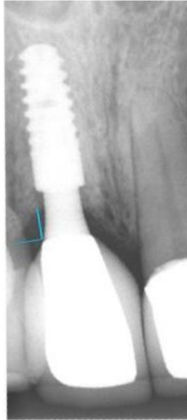
Imagem 2: radiografia tomada em consulta de acompanhamento após 12 meses da cirurgia.

Nas radiografias (imagens 1 e 2) podemos visualizar o grau de posicionamento subcristal e os pontos a serem analisados no sentido vertical e horizontal.