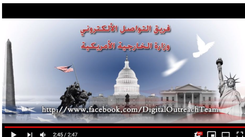
Figura 4 - A Casa Branca

Cenas de destruição e violência são frequentes na comunicação do grupo. Novamente aparece uma casa sendo explodida, agora no minuto 1'51". O vídeo prossegue com transições de imagens, vídeos e texto em árabe com fundo preto, até que, no final, surgem diversos membros uniformizados com grandes armas, num tom ameaçador. O integrante que está falando tem seu rosto coberto por um efeito blur do vídeo, até que este acaba com uma foto final mostrando a Estátua da Liberdade, a Casa Branca e o monumento de Washington, capital norte-americana.