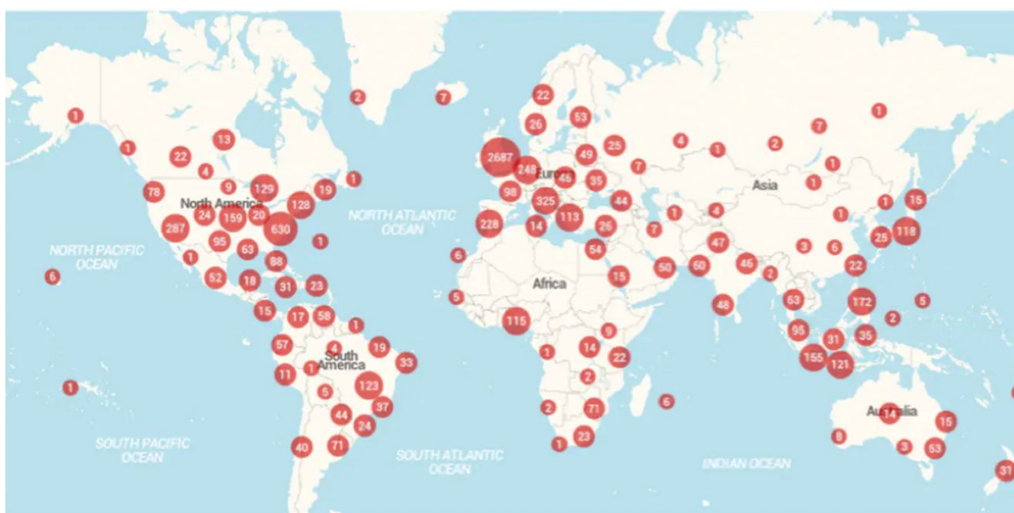
Figura 1 - Repercussão ataque de Paris 2015

(Data: NYU Social Media and Political Participation (SMaPP) Lab; Figure: Alexandra Siegel)