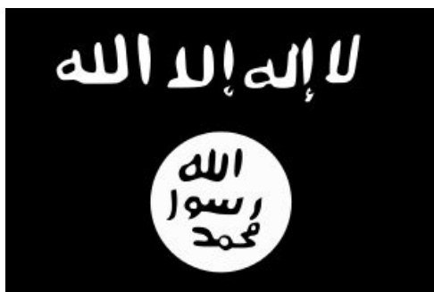
Figura 3 - logo do ISIS