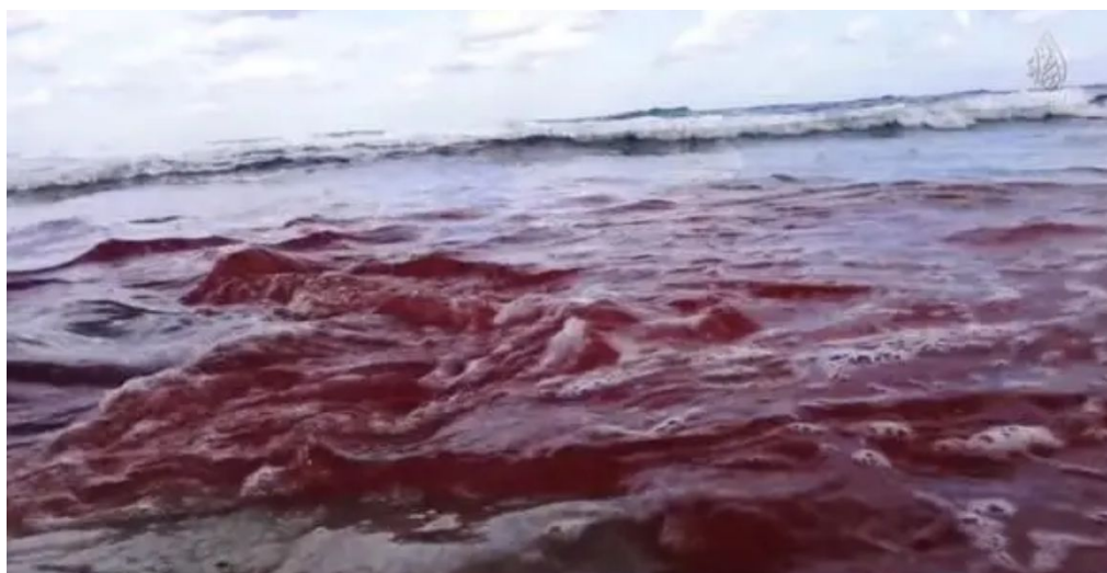
Figura 8 - Mar de sangue