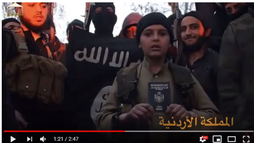
Figura 3 - Menino e o passaporte