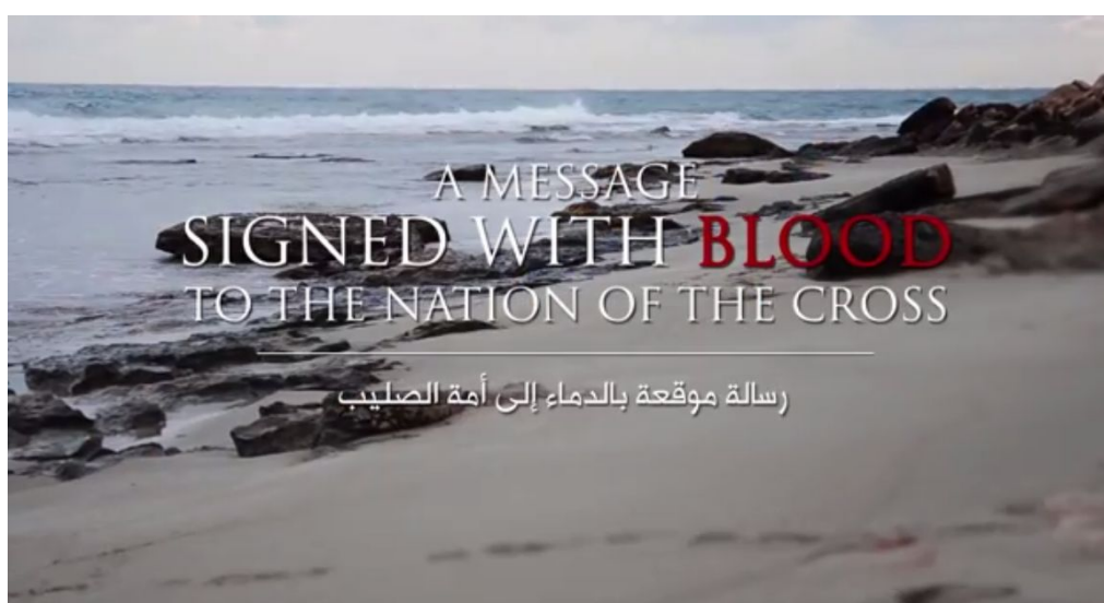
Figura 5 - Início do vídeo