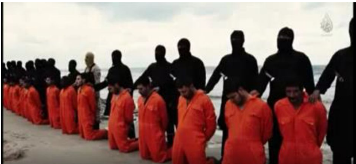
Figura 7 - prisioneiros e jihadistas