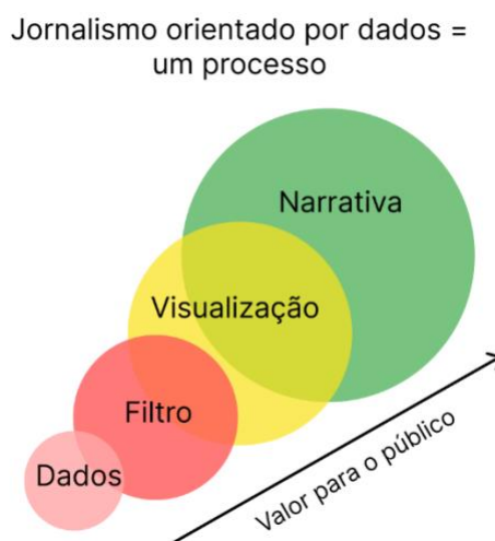
Figura 1. O processo do jornalismo orientado por dados (adaptado de: http://mediapusher.eu/datadrivenjournalism/pdf/ddj_paper_final.pdf )

O Jornalismo de Dados também pode ser considerado um processo de refinamento do dado bruto, no qual habilidades provenientes de áreas como estatística, programação e design são incorporadas aos dados com o objetivo de agregar valor às informações e facilitar a comunicação sobre elas.