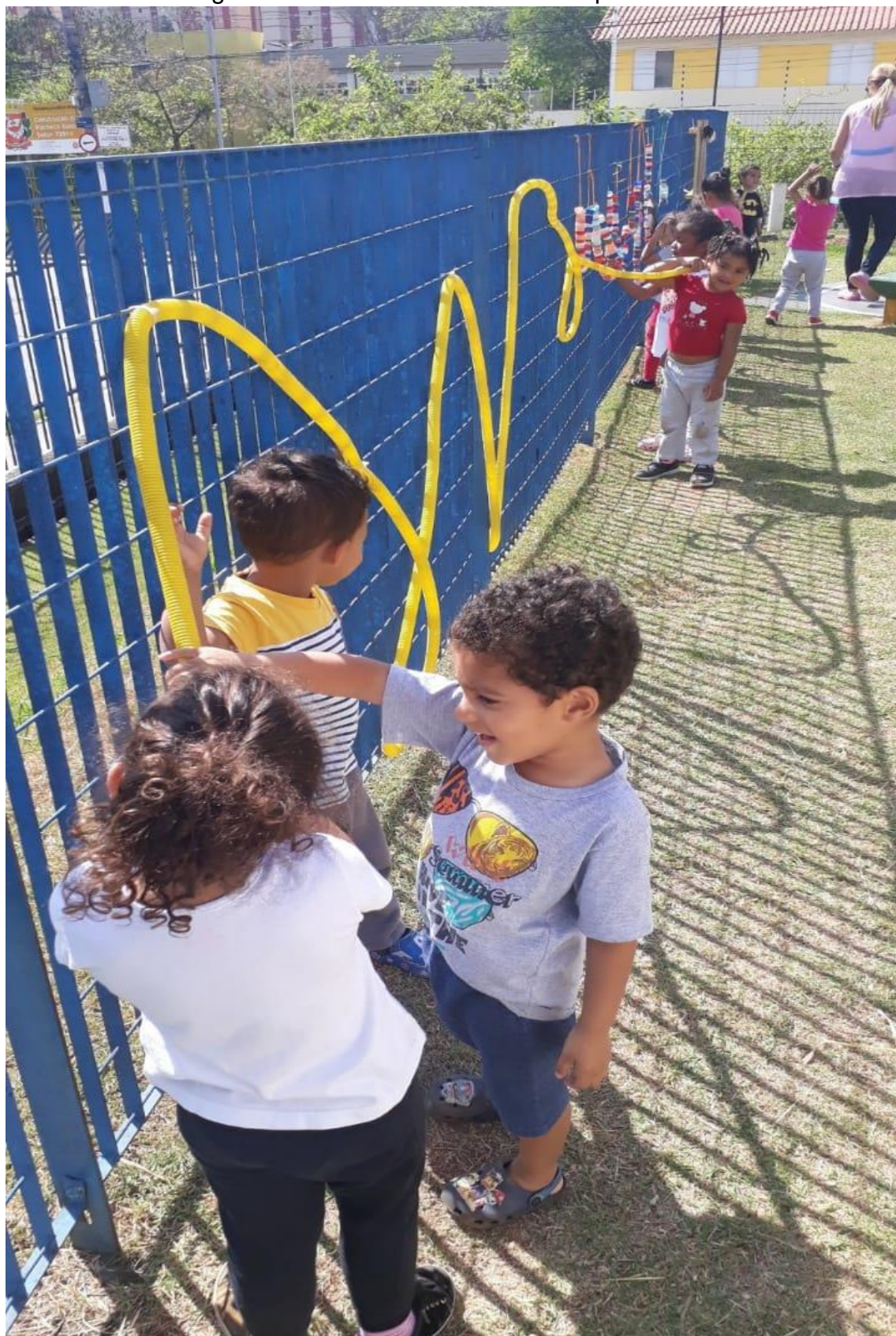
Figura 16: Conhecendo Nosso Parque Sonoro