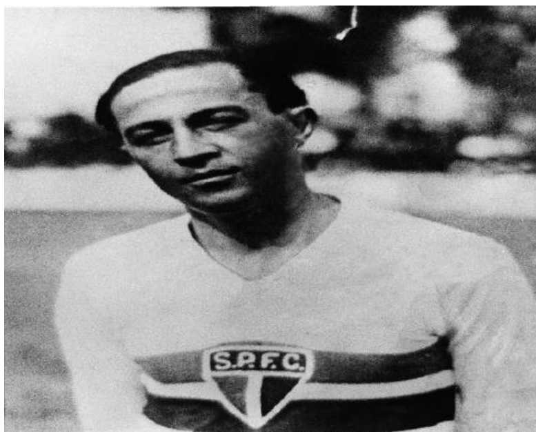
Figura 1 - Friedenreich com a camisa do São Paulo Futebol Clube, 1930

O primeiro marco da seleção nacional na história é o Campeonato Sul-Americano de Futebol de 1919, torneio sediado pelo Brasil e no qual a seleção brasileira, comandada por Friedenreich, conquista o seu primeiro título internacional.