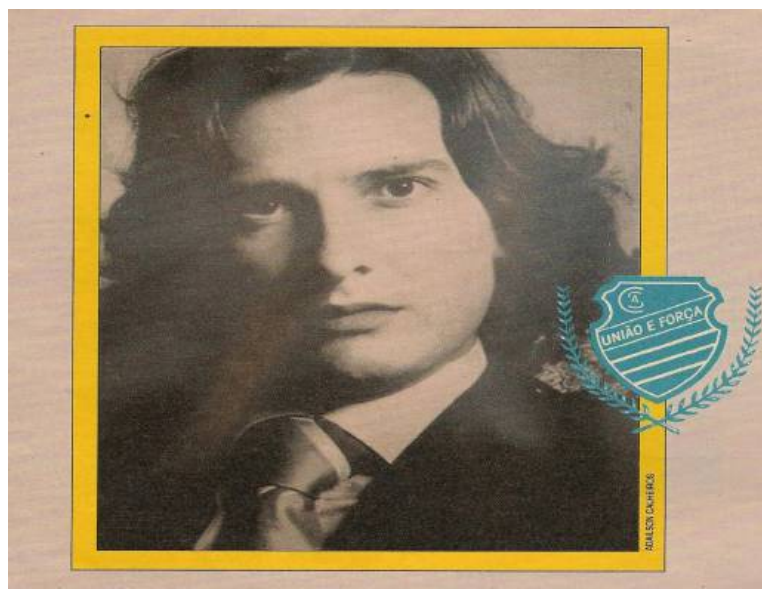
Figura 12 - Fernando Collor, presidente do CSA de Alagoas

A história de Fernando Collor é intimamente relacionada com o futebol. O político de Alagoas, em 1973, assumiu a presidência da equipe Centro Sportivo Alagoano, conhecida pela sigla CSA. O jovem Fernando tinha apenas 24 anos e seu mandato no clube de Maceió marcou o pontapé inicial de uma carreira política que culminou com a vitória na disputa presidencial de 1989. Collor foi o primeiro e único presidente do Brasil que começou a carreira pública como presidente de um clube de futebol.