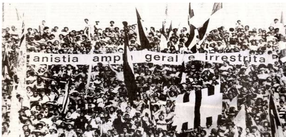
Figura 10 - Faixa pedindo 'Anistia ampla, geral e irrestrita' exibida em partida entre Corinthians e Santos, 1979

Estádio Nacional de Santiago, na primeira partida depois que o estádio foi liberado, após servir de prisão por dois anos e meio, no Estádio onde morreram patriotas chilenos e brasileiros, que houve um apagão, a primeira manifestação por liberdade, durante a ditadura Pinochet. Quando as pessoas se deram conta, estava tudo apagado, e começou um canto: "libertad, libertad, libertad". Havia sessenta mil pessoas no jogo entre o Universidad Católica e o Colo Colo, e seria impossível colocar sessenta mil pessoas dentro de camburões. (p. 31-32)