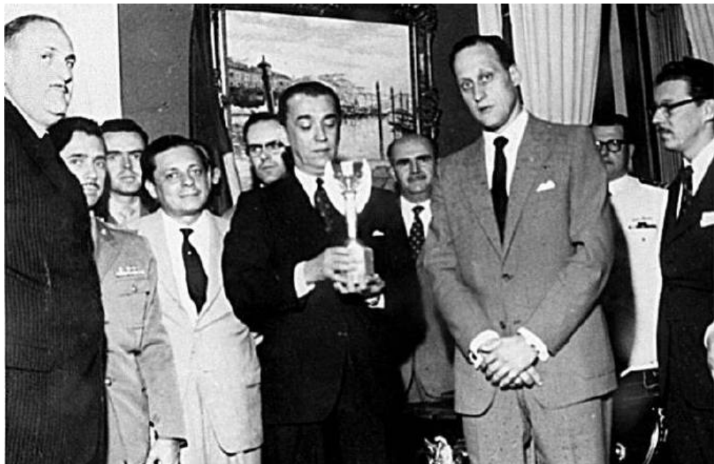
Figura 6 - Kubitschek com a taça da Copa em recepção à seleção, 1958

Dois dias após a vitória na Suécia, que enlouqueceu os brasileiros de alegria e orgulho, Kubitschek inaugurou em Brasília o Palácio da Alvorada, primeiro marco da nova capital do país.