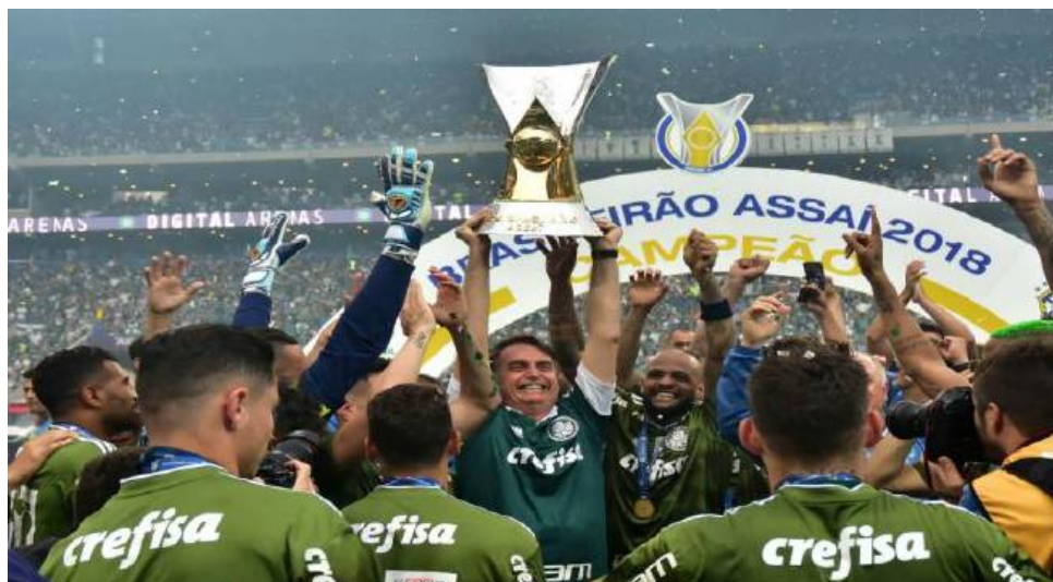
Figura 18 – Bolsonaro participa da festa do título do Campeonato Brasileiro do Palmeiras, 2018