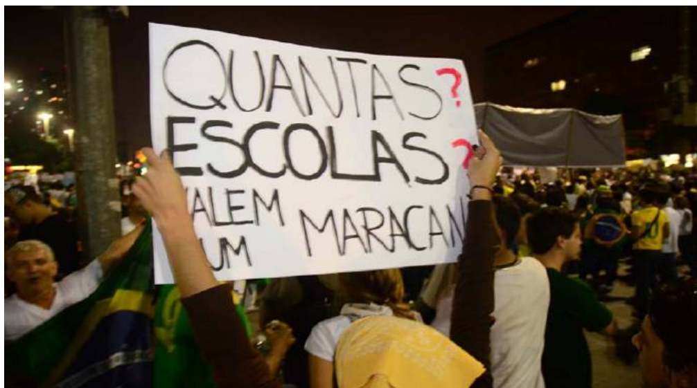
Figura 14 – Cartaz com a frase “Quantas escolas valem um Maracanã?” em protesto de junho de 2013