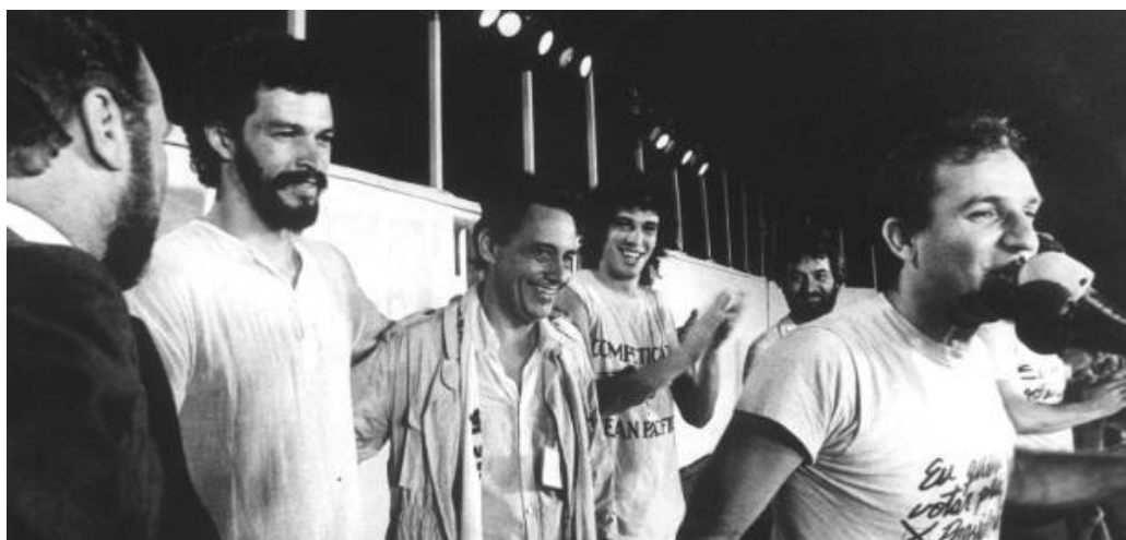
Figura 11 - Sócrates participando de ato pelas Diretas, 1984

tendo como inspiração a possibilidade concreta de mudanças para a população. Lira Neto (2012) menciona que o futebol é o esporte mais enraizado em nossa cultura, e mostra-se compatível com as características dos brasileiros, o que torna possível dizer que a nossa sociedade se expresse pelo esporte.