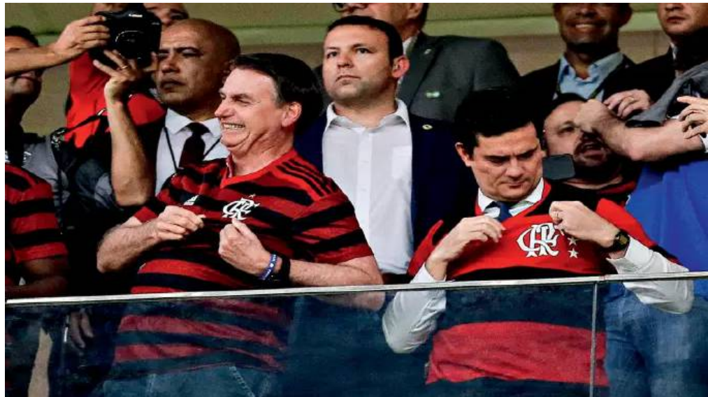
Figura 17 – Jair Bolsonaro e Ministro da Justiça, Sérgio Moro, em jogo do Flamengo contra o CSA, 2019