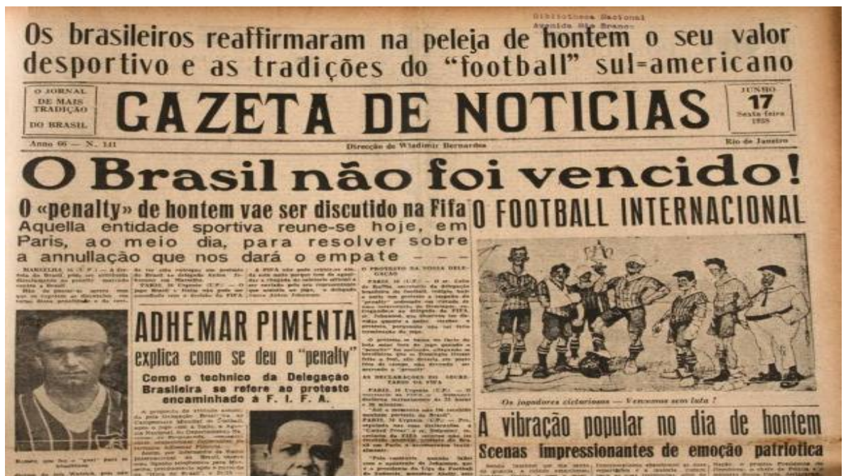
Figura 3 - Capa da Gazeta de Notícias, 17/06/1938

O jogo de ‘football’ 5 monopolizou as atenções. A perda do ‘team’ 6 brasileiro para o italiano causou uma grande decepção e tristeza no espírito público, como se se tratasse de uma desgraça nacional. (p.140)