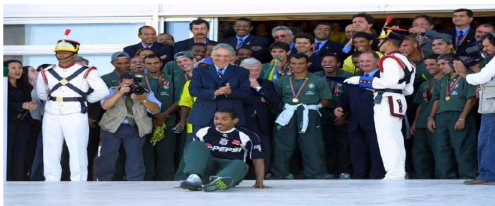
Figura 13 - Jogador Vampeta dá cambalhotas na rampa do Planalto, em encontro com Fernando Henrique Cardoso, comemorando o título de 2002

Pouco se esperava e tudo se conseguiu daquela seleção brasileira de 2002. A campanha foi impecável: sete jogos, sete vitórias, contando com grandes nomes, como Ronaldo, Rivaldo e Ronaldinho, o Brasil driblou os resultados ruins das eliminatórias e foi campeão com sobras. Foi a Copa de Ronaldo, o Fenômeno. Recuperado de graves lesões no joelho, o atacante alcançou sua consagração máxima ao ser campeão, artilheiro e craque da seleção vencedora do Mundial. Fez oito gols, dois deles na final, contra a Alemanha, e outro nas semifinais, diante da Turquia.