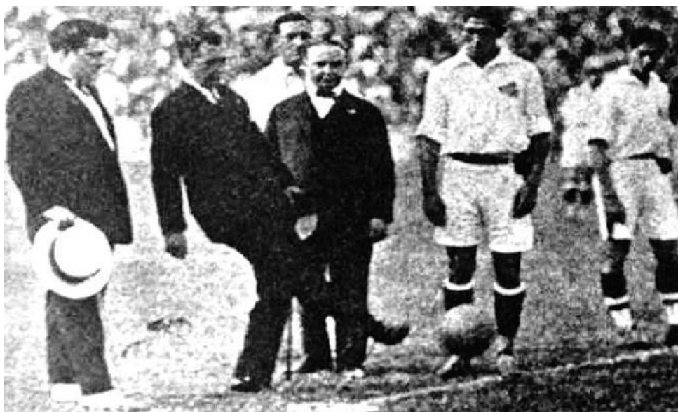
Figura 2 - Presidente da República Washington Luís na inauguração do Estádio São Januário, 1927