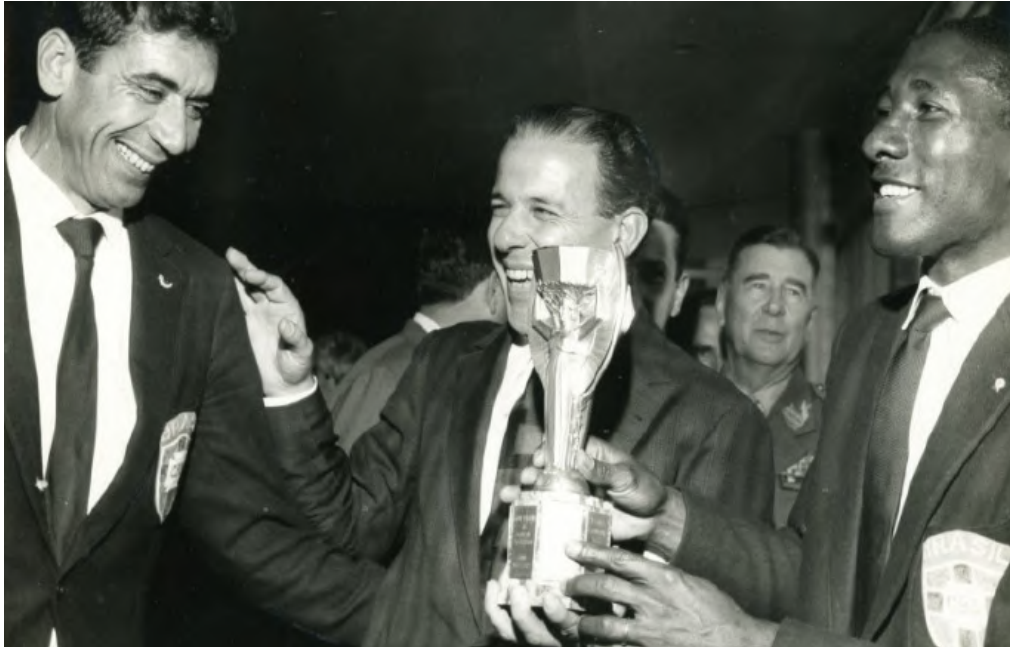
Figura 7 - João Goulart recebendo a equipe bicampeã do mundo, 1962

de políticas sociais concretas, tendo a seleção de futebol como modelo das transformações imaginadas.