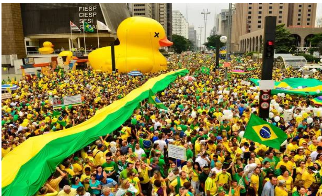
Figura 15 – Camisa da seleção brasileira é ícone de protestos contra governo Dilma, 2016