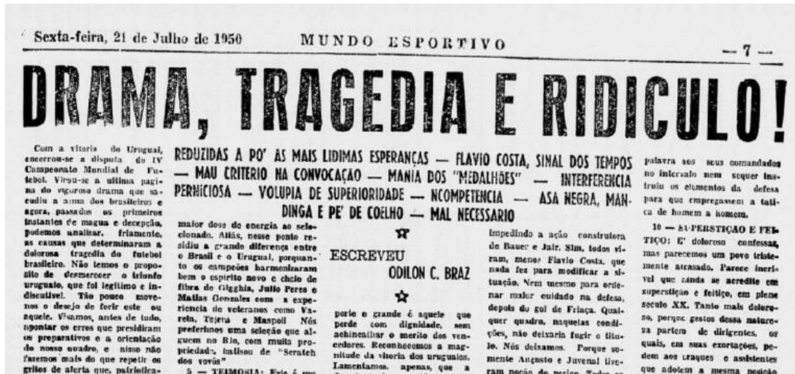
Figura 5 - Matéria do jornal Mundo Esportivo, 21/06/1950

Rio de Janeiro, definiu a derrota como o presente que não merecíamos “Desilusão e lágrimas – prêmio que recebeu a torcida brasileira”.