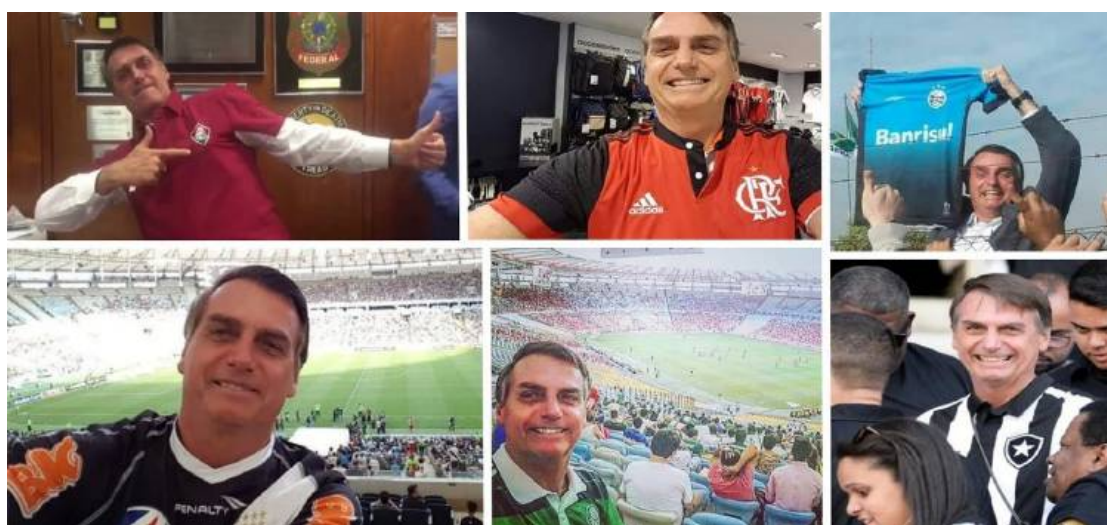
Figura 16 – Compilação de fotos com Bolsonaro vestindo diversas camisas de clubes brasileiros

Mas não parou por aí no que tange vestir camisas de diversos outros clubes do país. Fez aparições com camisas de clubes das regiões Sul, Sudeste, Centro-Oeste e Nordeste, todas com ao menos um clube na primeira divisão do Campeonato Brasileiro, que consideravelmente recebe mais investimentos do que as divisões inferiores e é onde estão os clubes de maior torcida. Faltou apenas a região Norte, que teve um clube na série A pela última vez em 2005. Segundo informações obtidas via Lei de Acesso à Informação, divulgadas pelo jornal O Globo, Bolsonaro já foi presenteado com 38 uniformes de clubes e seleções desde o início do mandato (O Globo, 2019).