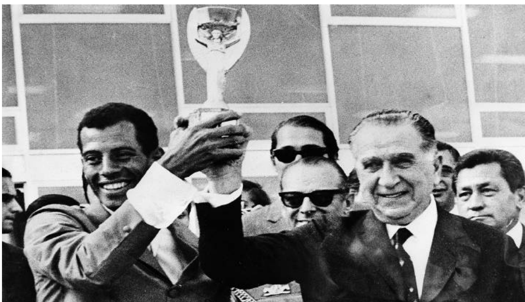
Figura 8 - Carlos Alberto Torres, capitão da Seleção, com o presidente Médici, erguendo a Taça Jules Rimet após a conquista do Tricampeonato, 1970

Foi uma festa. Não somente no México, como também no Brasil, apesar da ditadura. Ainda que as prisões, torturas e assassinatos de presos políticos atingissem um elevado grau de violência, as emissoras de rádio não paravam de tocar a música 'Pra frente Brasil'. (p. 94)