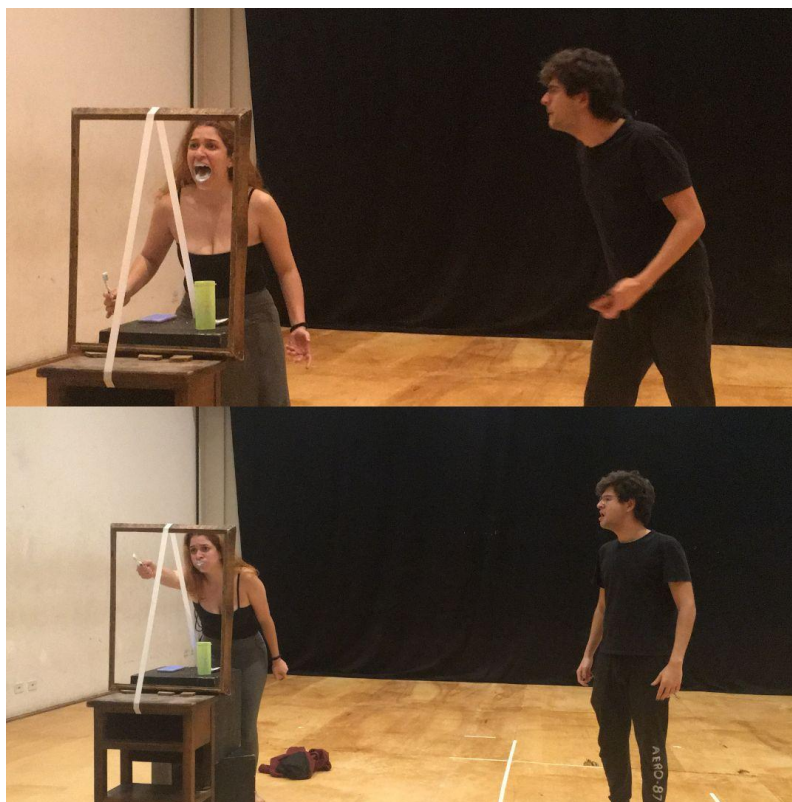
Figura 4- Placas bacterianas