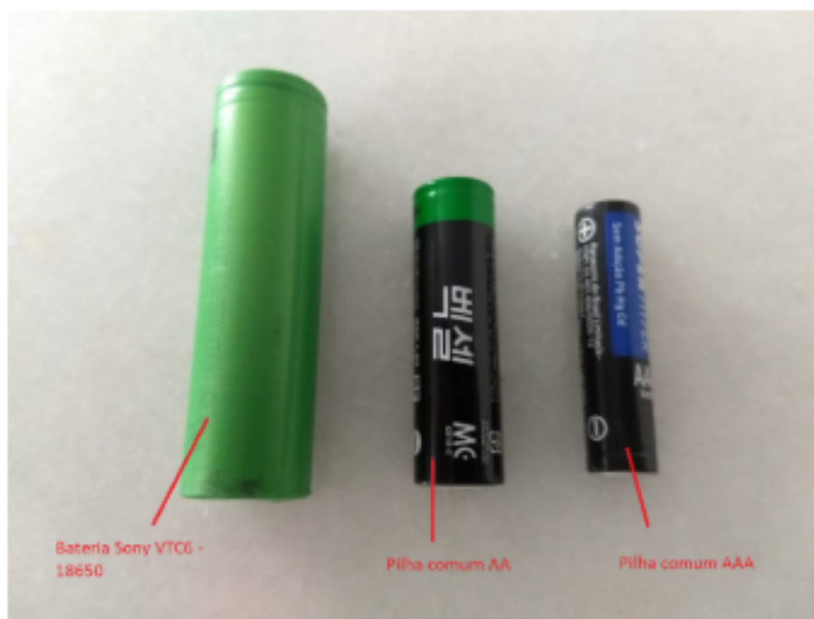
Figura 3 – As baterias tem tamanhos muito diferentes. A 18650 (verde) pode ser confundida com uma bateria para laptops e notebooks