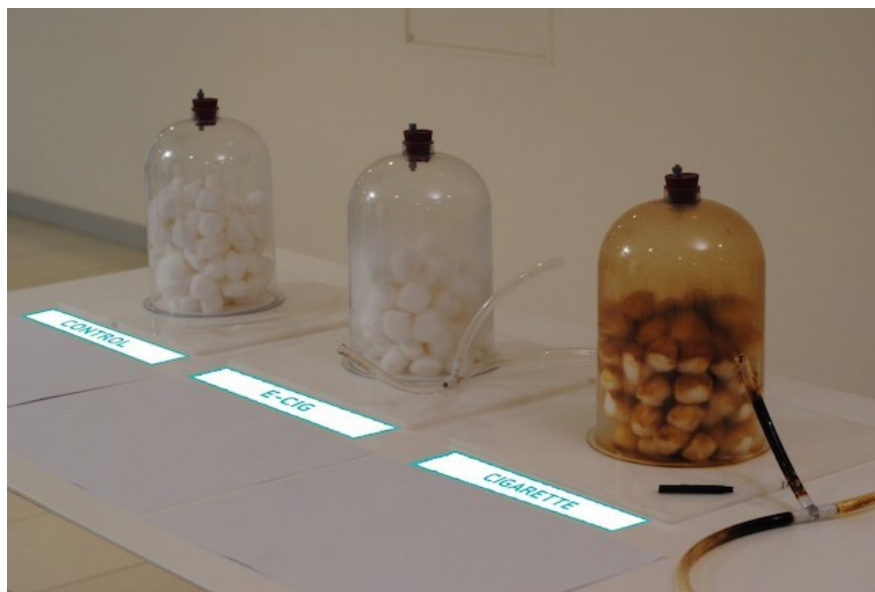
Figura 5 – Final do Experimento Health Harms