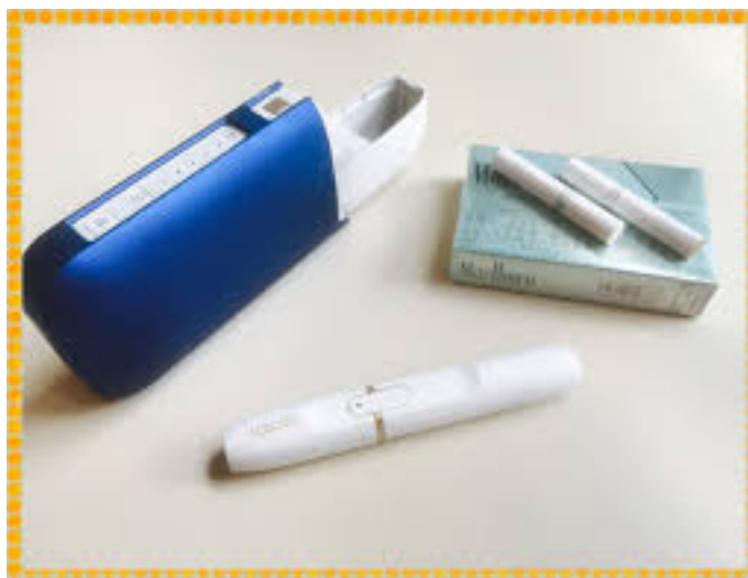
Figura 4 – IQUOS, o cigarro eletrônico da Philip Morris International