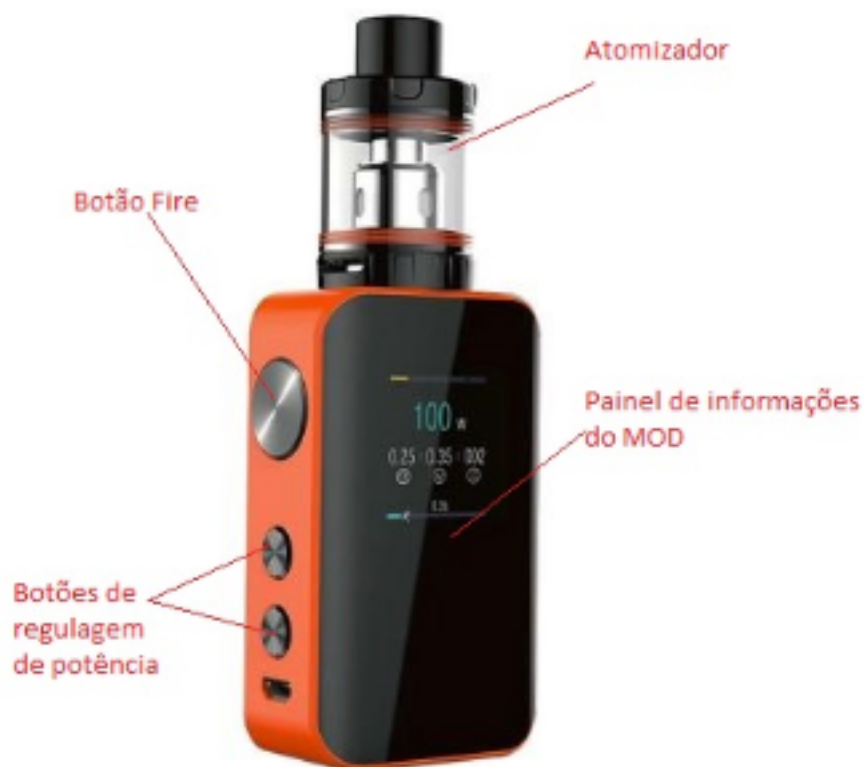
Figura 2 – A imagem foi editada para fins de esclarecimento