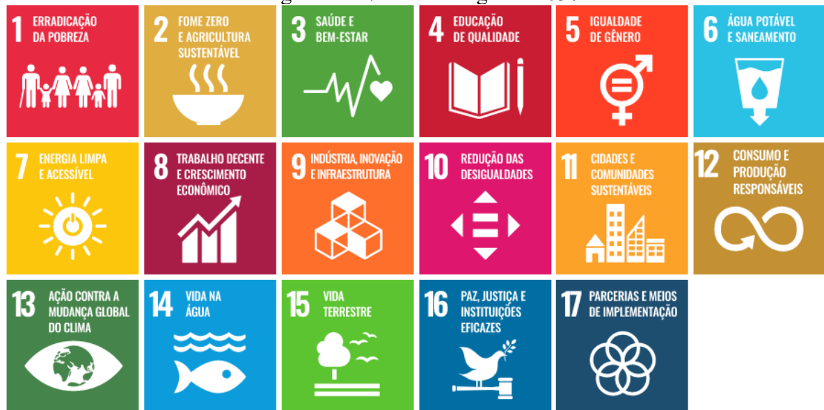
Figura 1 - 17 ODS da Agenda 2030