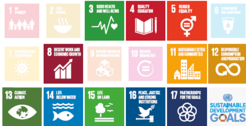
Figura 3 - ODS chaves da Agenda 2030 que o COI planeja contribuir

Key SDGs to which the IOC aims to contribute.