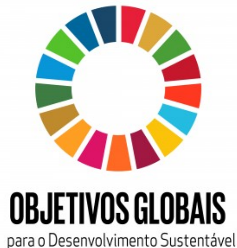
Figura 4 - Logo dos ODS

Apesar de não ter sido possível analisar as reais contribuições dos Jogos Olímpicos de Tóquio 2020 no atingimento dos ODS por conta do tempo de elaboração deste trabalho, foi possível observar em reportagens da imprensa que cobriu os Jogos algumas ações efetuadas em prol dos ODS durante a sua execução. Na cerimônia de abertura, uma das apresentações com blocos de madeira recriou o símbolo dos ODS, demonstrando desde o início do evento o comprometimento e apoio à Agenda da ONU.