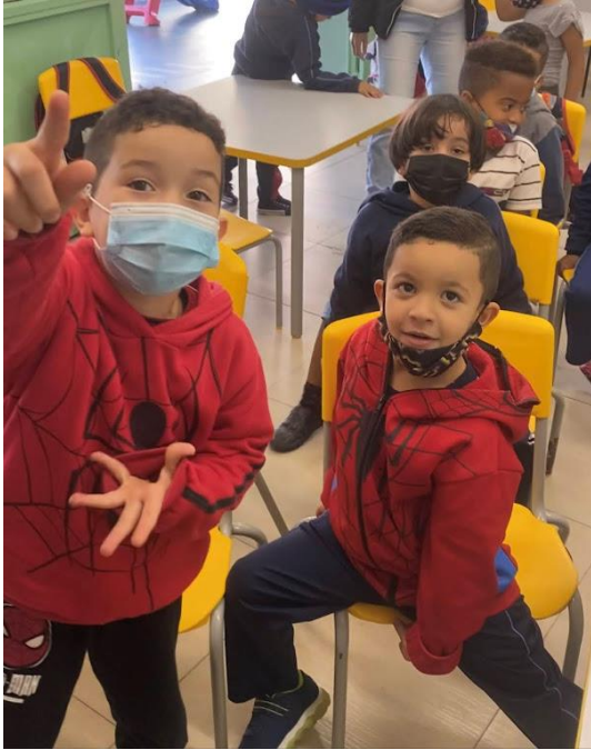
Figura 38 - Protocolos