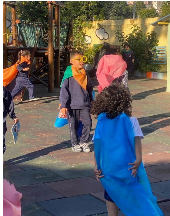
Figura 13 - Performances no parque com TNT