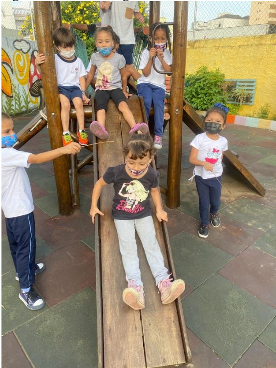
Figura 3 - Varinhas mágicas

começaram a planejar estas brincadeiras/performance, representando papéis, criando falas e se interessando pelos materiais disponibilizados (FIG.5 a 9).