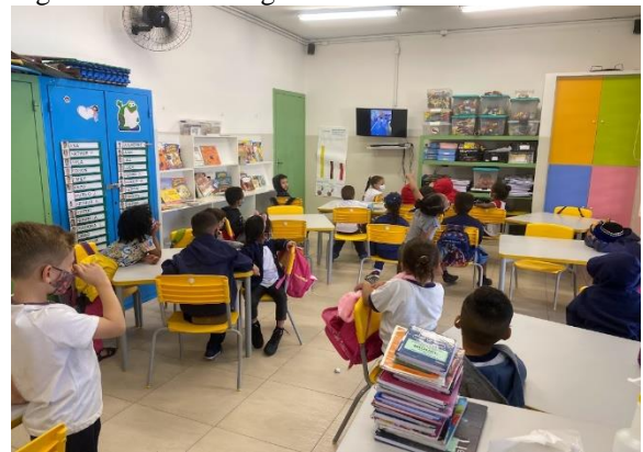
Figura 31 - Caixa mágica