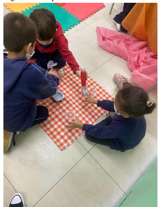
Figura 18 - Experiência com TNT na sala de