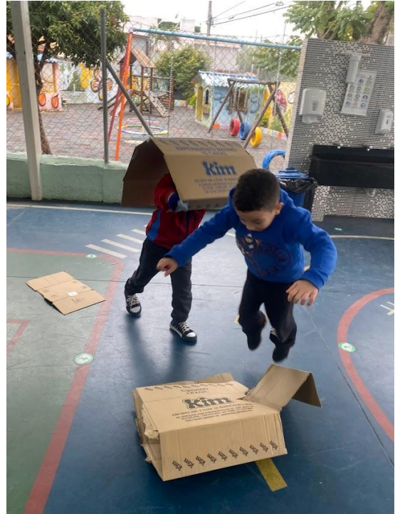
Figura 26 - Experiência com TNT na sala de aula