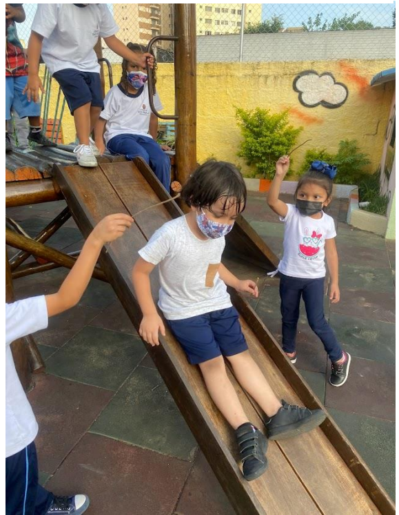
Figura 2 - Portal mágico