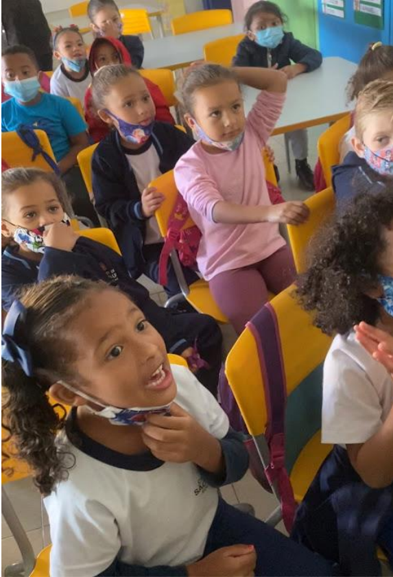
Figura 34 - Protocolos