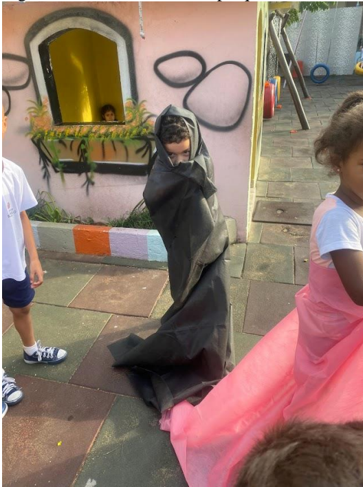
Figura 12 - Performances no parque com TNT