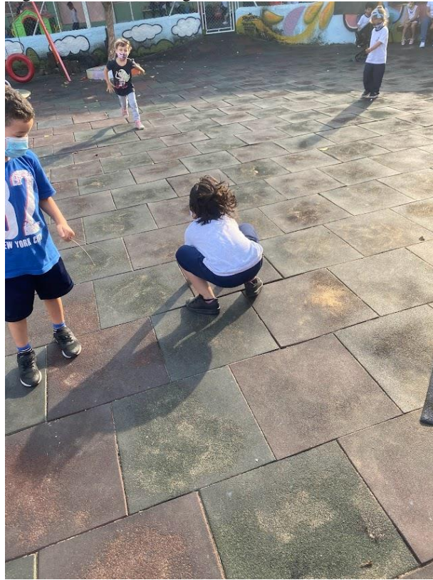
Figura 4 - Varinhas mágicas