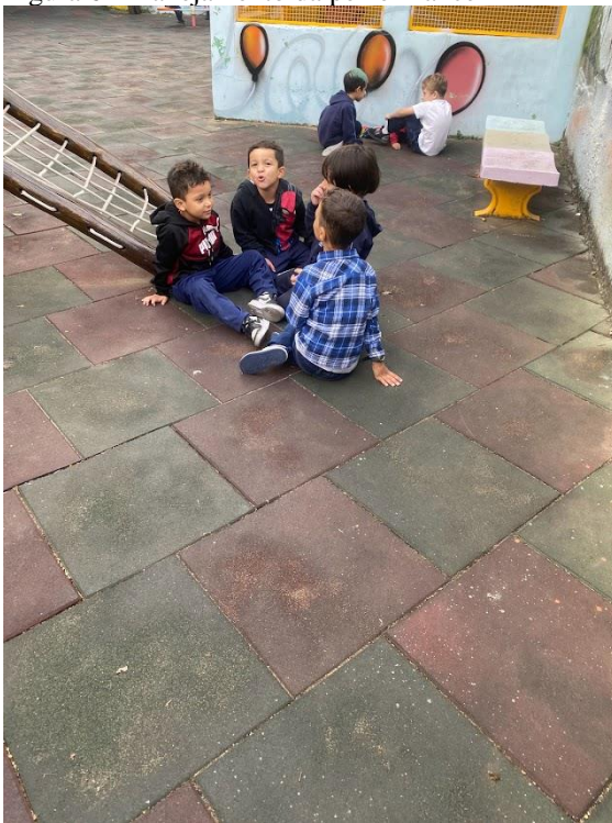
Figura 6 - Planejamento da performance