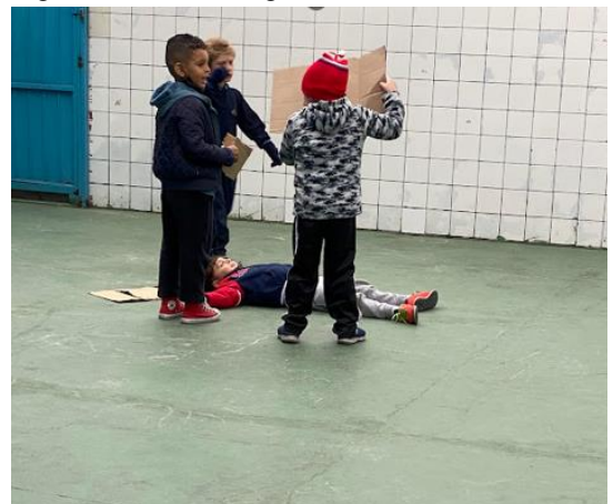
Figura 29 - Caixa mágica

Os momentos de avaliação e autoavaliação por meios dos protocolos aconteceram em quatro momentos no formato de conversa, apresentação de fotos dos encontros e registro das falas sendo: