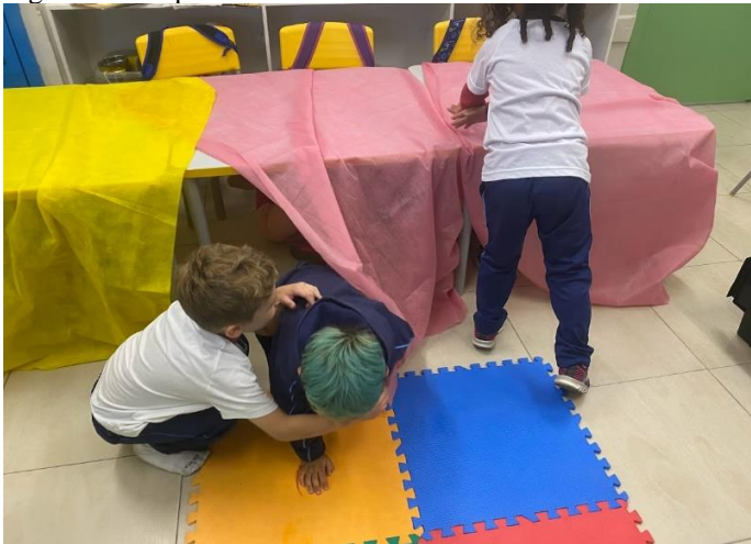
Figura 19 - Experiência com TNT na sala de aula

Ao chegarem na sala eles ficaram surpresos, sem saber o que fazer, um deles perguntou? - Onde a gente vai sentar? - Onde vocês quiserem! Respondi. Então outra criança perguntou se podia entrar embaixo da mesa, acenei com a cabeça que sim e logo eles saíram pegando os TNT e cobrindo as mesas, fazendo casinhas, ônibus com as cadeiras, cinema, e até um salão de beleza do qual fui convidada a participar! (FIG.18 a 23)