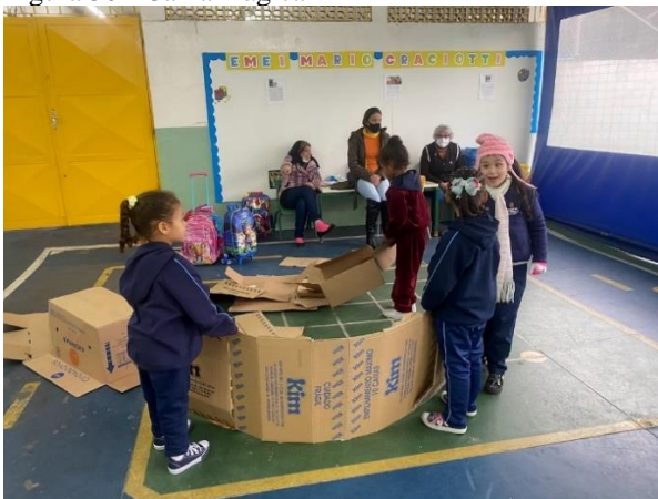
Figura 30 - Caixa mágica