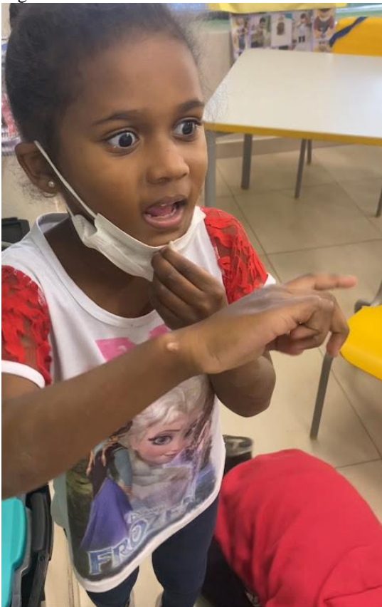
Figura 36 - Protocolos