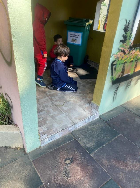
Figura 9 - Planejamento da performance