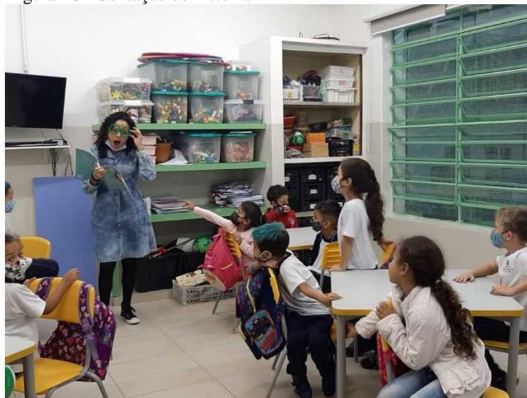
Figura 10 - Contação de história

Ao chegarem no parque, logo os pequenos encontraram a caixa e vieram me perguntar para que era aquilo. Rapidamente um deles disse: - Para brincar ?! Apenas acenei com a cabeça que sim, então eles pegaram os TNT e começaram a criar!