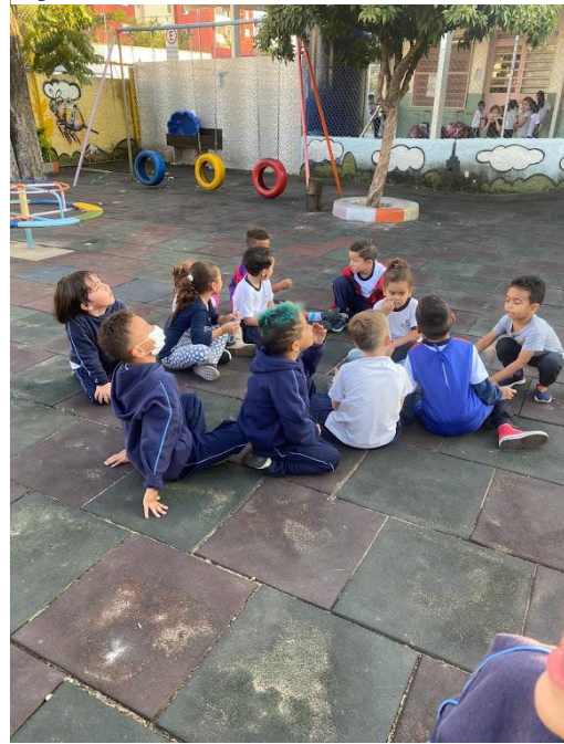
Figura 37 - Protocolos