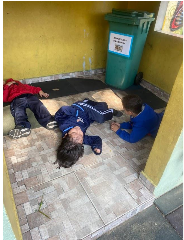
Figura 8 - Desenvolvimento da performance