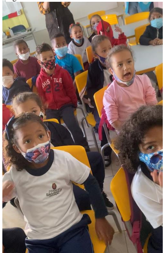
Figura 33 - Protocolos