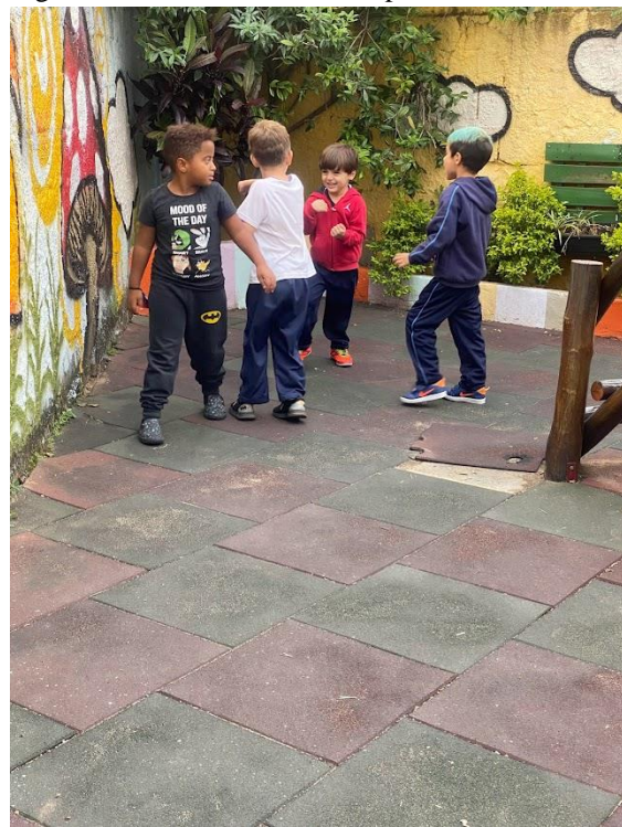
Figura 5 - Desenvolvimento da performance