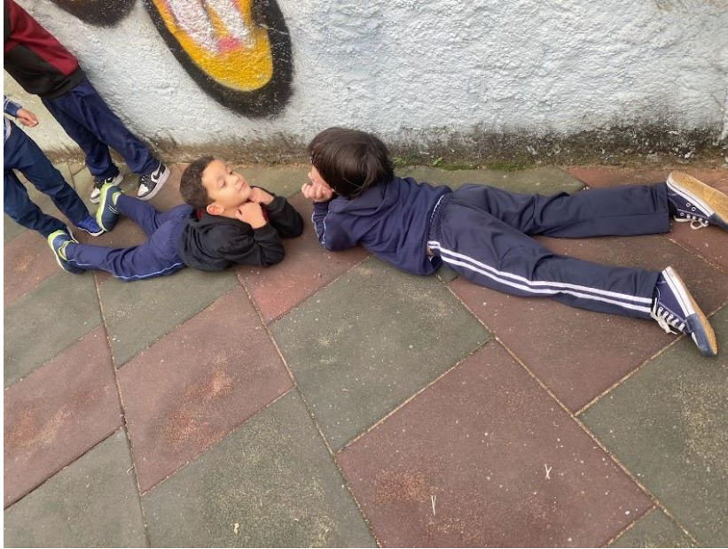
Figura 7 - Desenvolvimento da performance