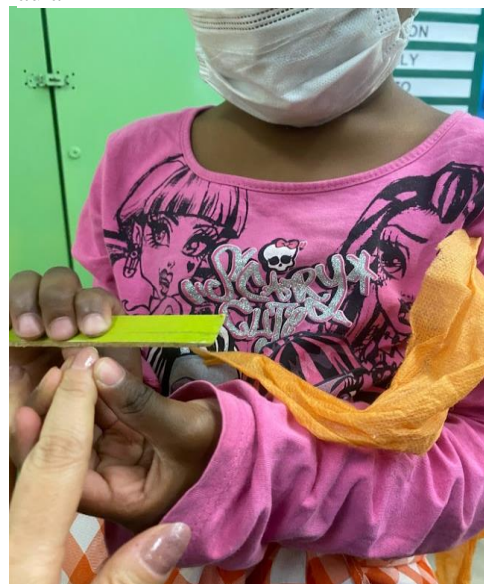
Figura 22 - Experiência com TNT na sala de aula