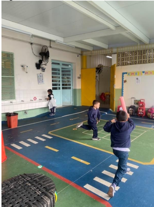
Figura 1 – Correndo em forma de S

Nas observações pude notar que as crianças ao saírem da sala, a principal ação era correr em forma de S, (SLADE, 1978, FIG. 1) pelos espaços externos, testando os limites de seus corpos. Para só depois se dividirem em pequenos grupos para organizar as brincadeiras.