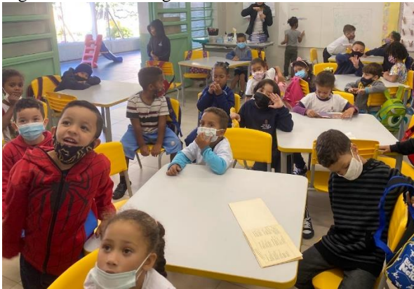
Figura 32 - Caixa mágica

4º Foi realizado com a apresentação de fotos da brincadeira com as caixas, e da performance dos galhos.