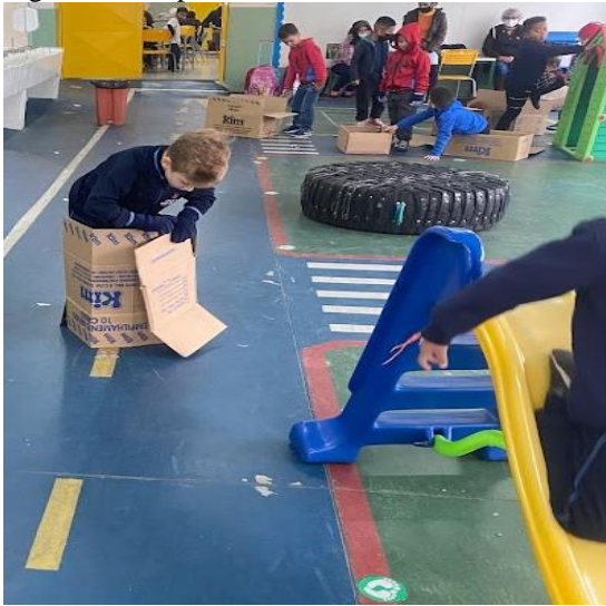
Figura 25 - Experiência com TNT na sala de aula

Conforme as caixas foram se desfazendo, eles foram inventando novas utilidades para os papelões. Um grupo de criança foi até a professora pedir fita, para construírem uma casa e ficaram um bom tempo, discutindo e testando as possibilidades para essa construção (FIG. 26 a 30).