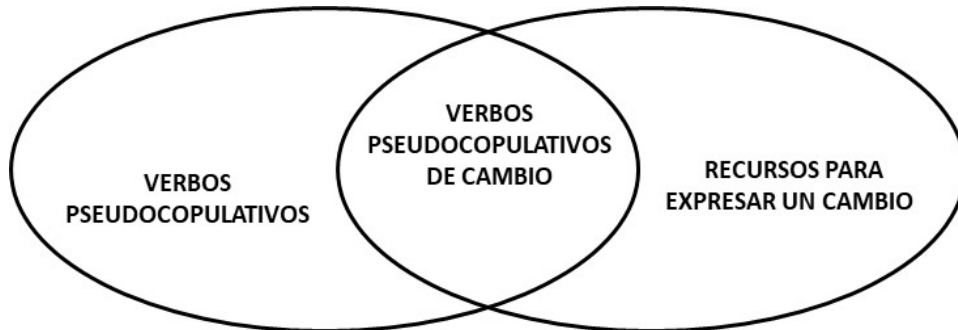
Figura 1. Representación esquemática de la relación entre verbos pseudocopulativos y recursos para expresar la noción de cambio en español

Aunque forman parte de un solo conjunto, no hay una auténtica sinonimia entre los verbos pseudocopulativos de cambio (VAN GORP, 2017, p. 43). Un criterio de clasificación de esos verbos lo han propuesto Morimoto y Pavón Lucero (2007, pp. 37-38): este tiene que ver con las restricciones que tales verbos presentan en relación con qué tipo de atributos pueden combinarse. Las autoras observan, entonces, tres grupos: