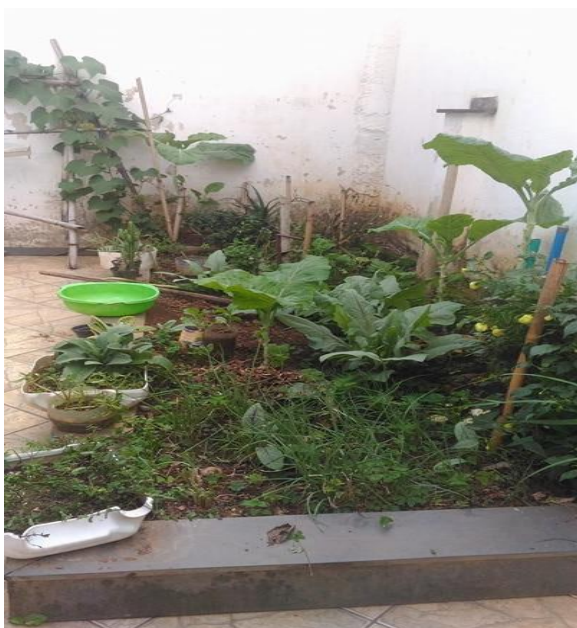
Foto 3. Horta adaptada no quintal da casa de C., em Mariana. (Foto de Thaís N. Rosenthal, maio de 2017)

Na zona rural as mulheres tinham espaço para cultivar seus próprios alimentos: a horta, tantas vezes citada nas entrevistas, além de fonte de alimentos saudáveis e em grandes quantidades, era também parte da rotina de cuidados dessas mulheres. Elas também criavam animais como galinhas para alimentação. Agora, em Mariana, as mulheres não têm espaço para hortas, com poucas exceções, como a de C., que aparece na foto abaixo (Foto 3), com seu quadradinho de horta no quintal de casa. Além do gasto de dinheiro, elas falam também dos agrotóxicos (“compra com doença”) e de terem que congelar os alimentos, que reduz sua qualidade. É bastante provável que os hábitos alimentarem dessas mulheres e de suas famílias tenham piorado depois da mudança de cidade.