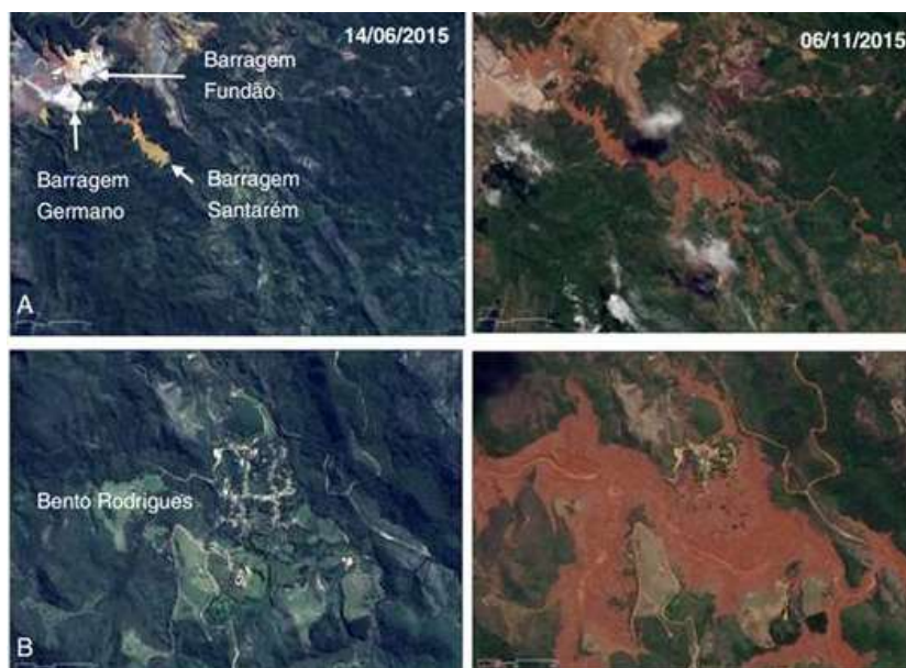
Figura 3. Imagens de satélite das barragens da Samarco (A) e do povoado de Bento Rodrigues (B) obtidas no dia 14/06/2015 (antes do rompimento da barragem) e 06/11/2015 (após o rompimento da barragem)