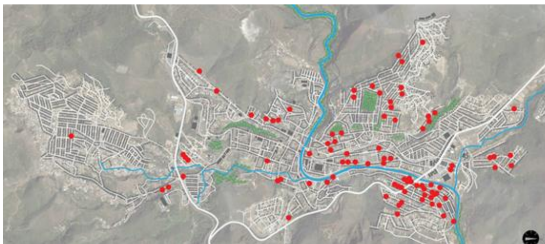
Figura 4. Mapa da cidade de Mariana, com as marcações feitas pelos próprios atingidos de onde eles estão morando após o desastre

Após o desastre, os moradores foram realocados primeiramente em hotéis, e posteriormente em casas alugadas pela Empresa Samarco, no município de Mariana, conforme apresentado na Figura 4, na qual se verifica a localização de algumas das casas que foram alugadas, onde vivem pessoas que costumavam ser vizinhas. Essa situação persiste até hoje, uma vez que a construção da nova Bento Rodrigues e Paracatu de Baixo ainda está em fase de planejamento.