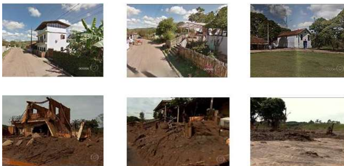
Foto 1: Sequência de imagens demonstrando os efeitos do rompimento da barragem do Fundão no distrito de Bentos Rodrigues. As fotos superiores e inferiores indicam a situação antes e após a passagem da onda de lama (rejeito), respectivamente, nas mesmas localidades.