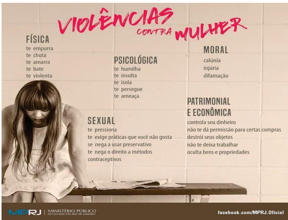
Figura 1. Campanha de divulgação das formas de violência definidas na Lei Maria da Penha.

A violência contra a mulher é a forma mais primitiva de impor a ela a posição de submissão. Porém é a violência simbólica, ou seja, a normalização social dos outros tipos de violência, que faz com que esse cenário continue. Um exemplo disso é a ilegalidade do aborto no Brasil. Saffioti (2013) escreve que a liberdade da mulher está totalmente ligada ao direito de escolha entre ser ou não mãe, e a criminalização do aborto tira da mãe essa possibilidade de escolha. A Pesquisa Nacional de Aborto de 2010 aponta que, ao final da vida reprodutiva, 1 a cada 5 mulheres já fez um aborto, e mais de 50% dos casos de aborto levou a internação (DINIZ e MEDEIROS, 2010). As autoras também mencionam que é provável que as mulheres com baixa renda, que não fizeram uso dos medicamentos, são as que realizaram abortos em condições mais precárias de saúde (quase metade dos casos).