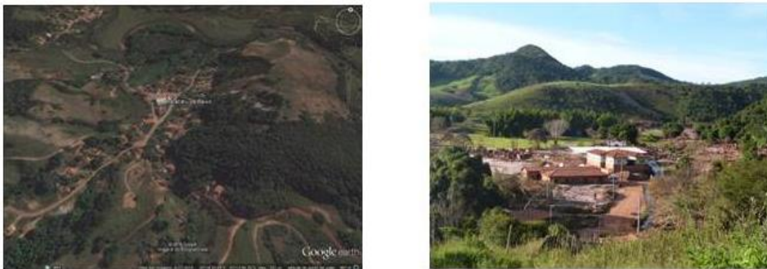
Foto 2: Imagens demonstrando os efeitos do rompimento da barragem do Fundão no distrito de Paracatu de Baixo, indicando a situação antes e após a passagem da onda de lama (rejeito) nas mesmas localidades (a imagem à esquerda foi obtida no Google Earth e a da direita é de Espindola, 2016)

Após o desastre, os moradores foram realocados primeiramente em hotéis, e posteriormente em casas alugadas pela Empresa Samarco, no município de Mariana, conforme apresentado na Figura 4, na qual se verifica a localização de algumas das casas que foram alugadas, onde vivem pessoas que costumavam ser vizinhas. Essa situação persiste até hoje, uma vez que a construção da nova Bento Rodrigues e Paracatu de Baixo ainda está em fase de planejamento.