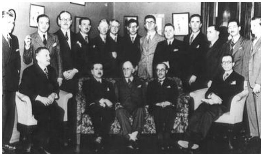
Figura 1. Professores fundadores da FFLC - 1934

Fonte: CAPH- Projeto Memória da FFLC/FFLCH-USP. Os professores contratados reúnem-se para comemorar a fundação da FFLC.