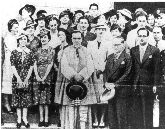
Figura 6. Formandos da 2ª Turma de FFLC - 1937

Fonte: CAPH- Projeto Memória da FFLC/FFLCH-USP. Formandos e professores diante da Catedral da Sé, em São Paulo (SP). Não há registros dos nomes.