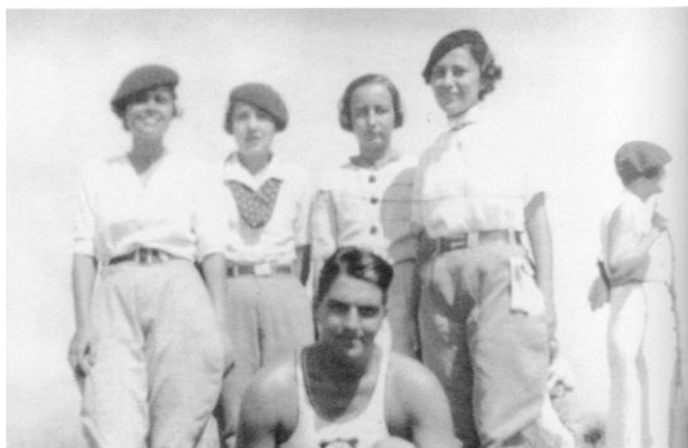
Figura 5. Excursão ao Pico do Jaraguá - 1937

Fonte: Acervo de Olga Pantaleão. BLAY, 2004, p.118.