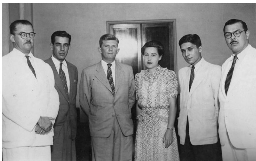
Figura 11. Recife - PE - 1944

Fonte: Acervo particular Ary França. (Boletim Paulista de Geografia, 2009, p. 98)