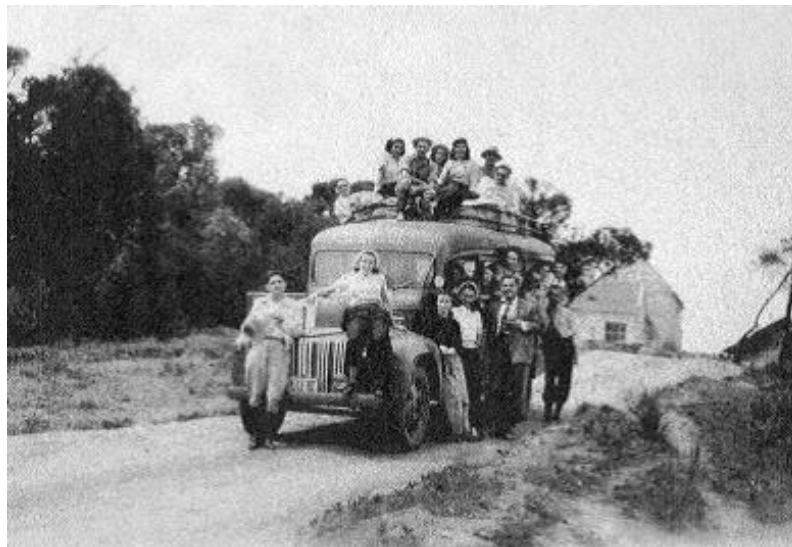
Figura 8. Excursão de campo no Vale do Ribeira- SP - Década de 40