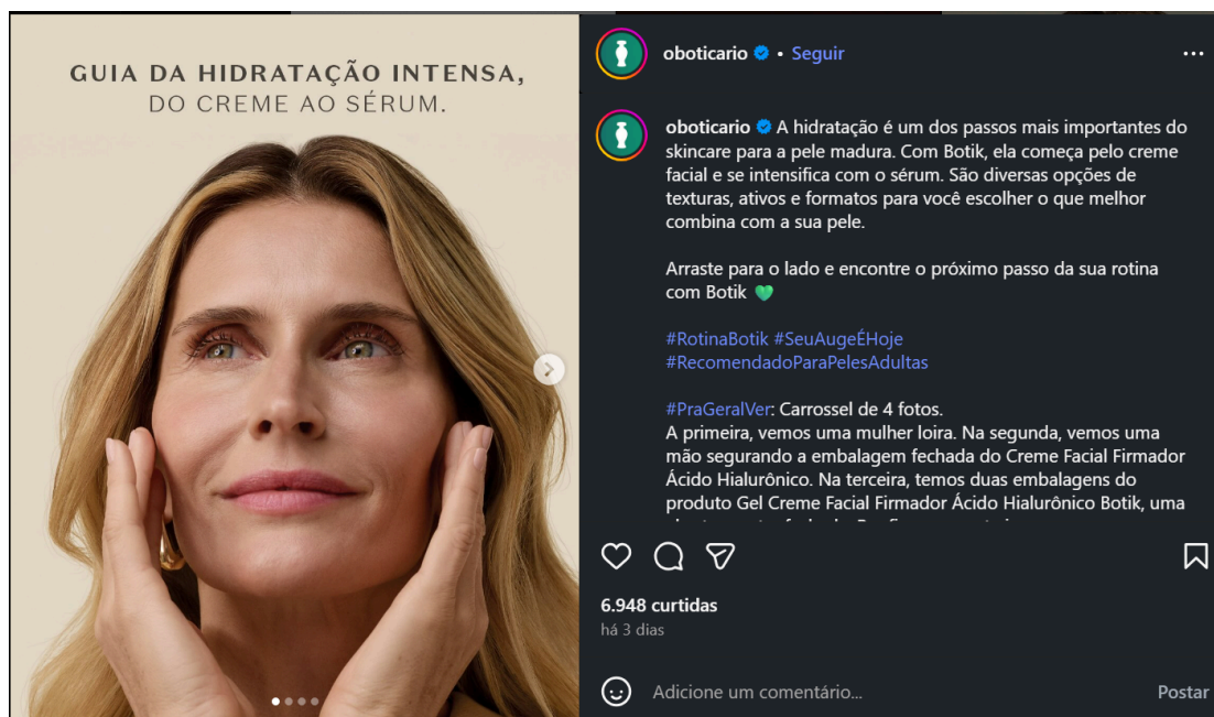
Figura 6 52 - guia de hidratação com a linha Botik, publicação parcial

Carrossel de 4 fotos. Peça gráfica à esquerda. À direita, legenda publicada pelo perfil. Publicação feita em 16/11/2025. Acesso em 19/11/2025.