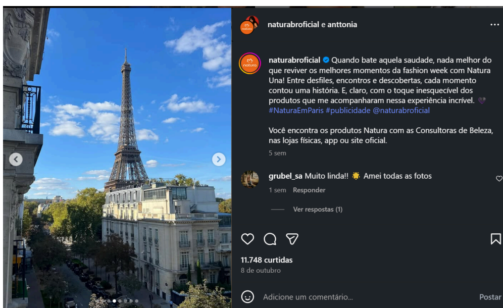
Figura 2 47 - divulgação dos melhores momentos da fashion week , publicação parcial

Carrossel de 8 fotos. Peça gráfica à esquerda. À direita-superior, legenda publicada pelo perfil; a parte inferior contém a seção de comentários. Publicação feita em 08/10/2025. Acesso em 19/11/2025.