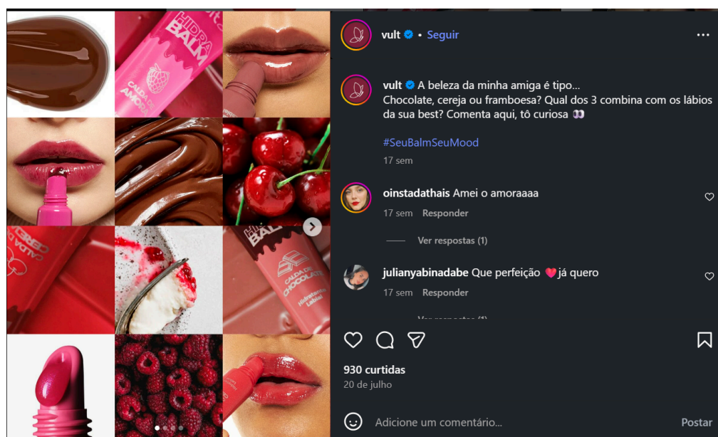
Figura 8 55 - interação com os usuários, publicação completa

Peça gráfica à esquerda. À direita-superior, legenda publicada pelo perfil; a parte inferior contém a seção de comentários. Publicação feita em 20/07/2025. Acesso em 19/11/2025.