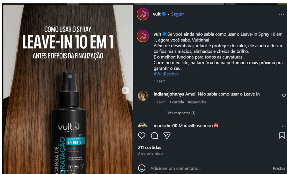
Figura 7 54 - guia de uso para o produto Leave-In Spray, publicação parcial

Carrossel de 5 fotos. Peça gráfica à esquerda. À direita-superior, legenda publicada pelo perfil; a parte inferior contém a seção de comentários. Publicação feita em 03/09/2025. Acesso em 19/11/2025.