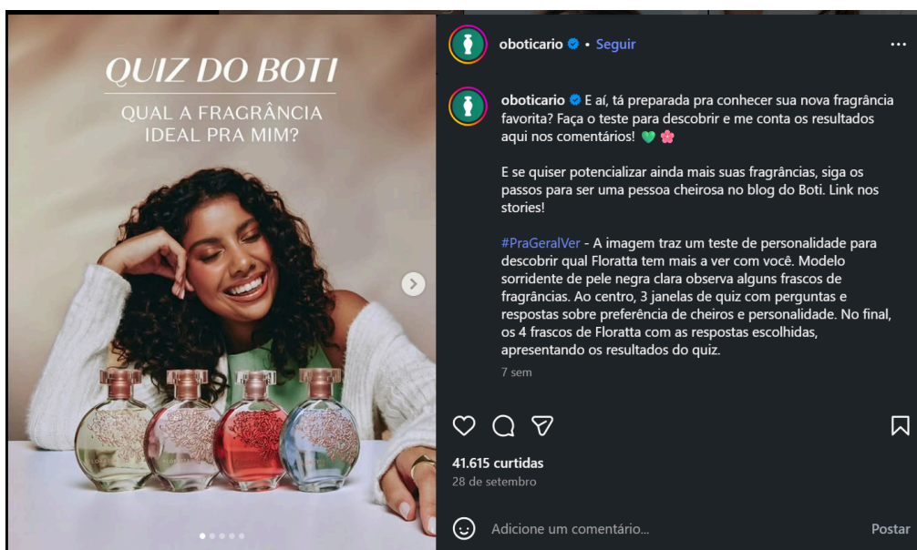
Figura 5 51 - divulgação do quiz do Boti, publicação parcial

Fonte: perfil do Instagram @oboticario. Carrossel de 5 fotos. Peça gráfica à esquerda. À direita, legenda publicada pelo perfil. Publicação feita em 28/09/2025. Acesso em 19/11/2025.