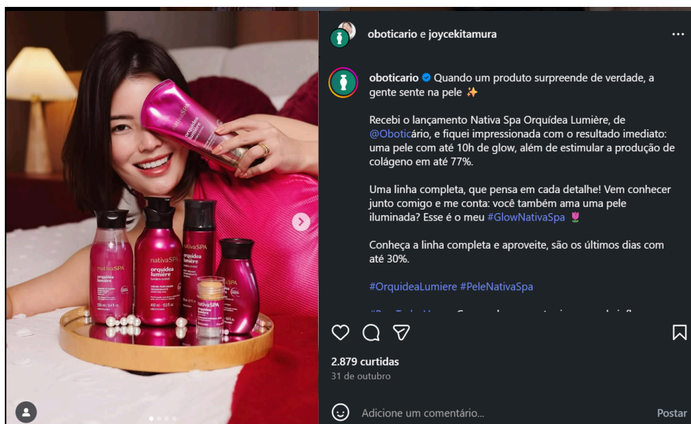
Figura 4 50 - divulgação do produto Nativa Spa Orquídea Lumière, publicação parcial

Fonte: perfil do Instagram @oboticario. Carrossel de 4 fotos. Peça gráfica à esquerda. À direita, legenda publicada pelo perfil. Publicação feita em 31/10/2025. Acesso em 19/11/2025.