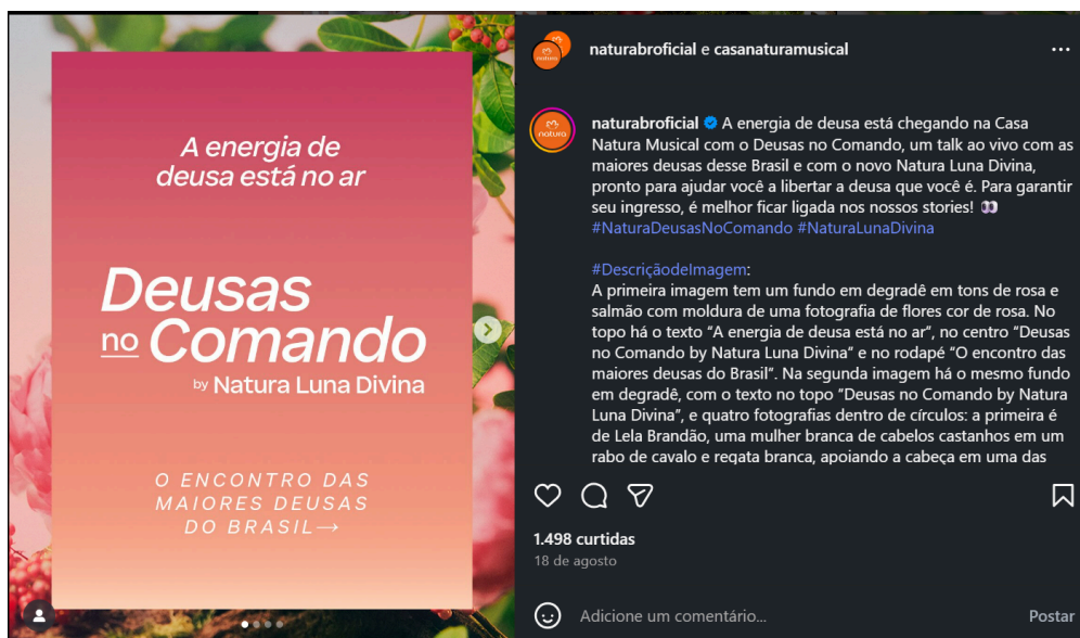
Figura 1 46 - divulgação do produto Natura Luna Divina, publicação parcial

Fonte: perfil do Instagram @naturabrofficial. Carrossel de 4 fotos. Peça gráfica à esquerda. À direita, legenda publicada pelo perfil. Publicação feita em 18/08/2025. Acesso em 19/11/2025.