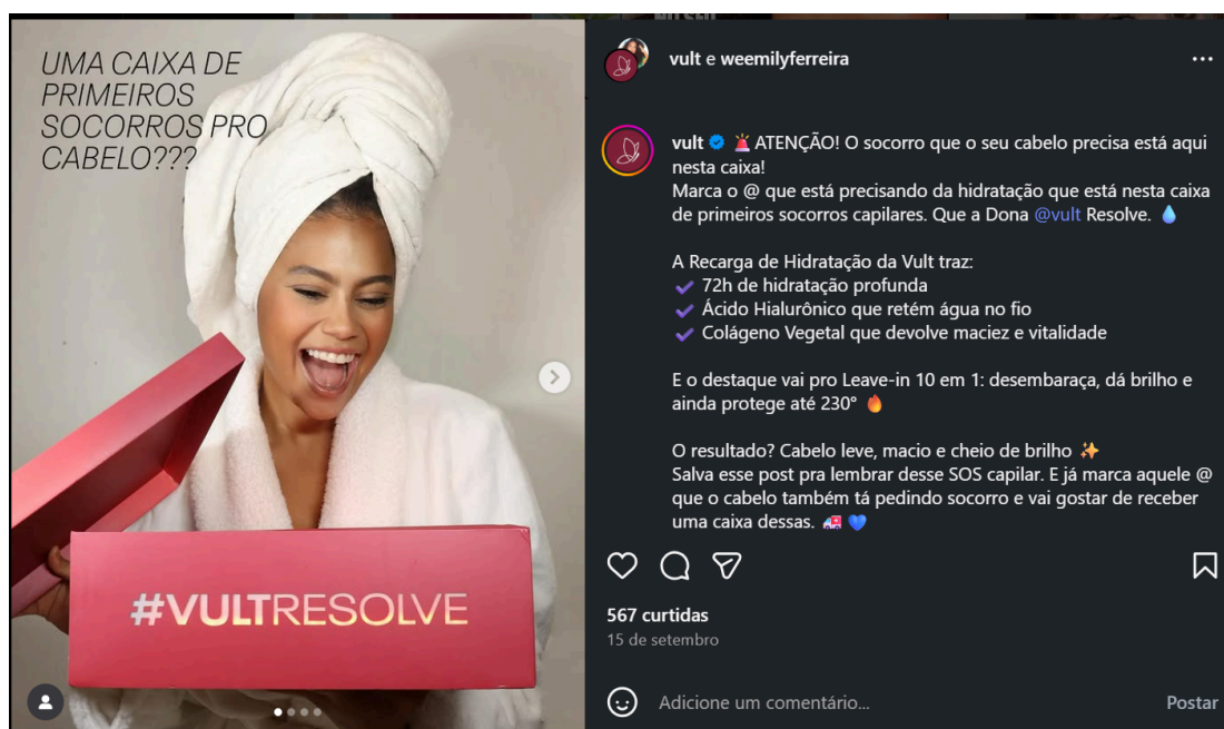
Figura 9 56 - divulgação do produto Recarga de Hidratação da Vult, publicação parcial

Fonte: perfil do Instagram @vult. Carrossel de 4 fotos. Peça gráfica à esquerda. À direita, legenda publicada pelo perfil. Publicação feita em 15/09/2025. Acesso em 19/11/2025.