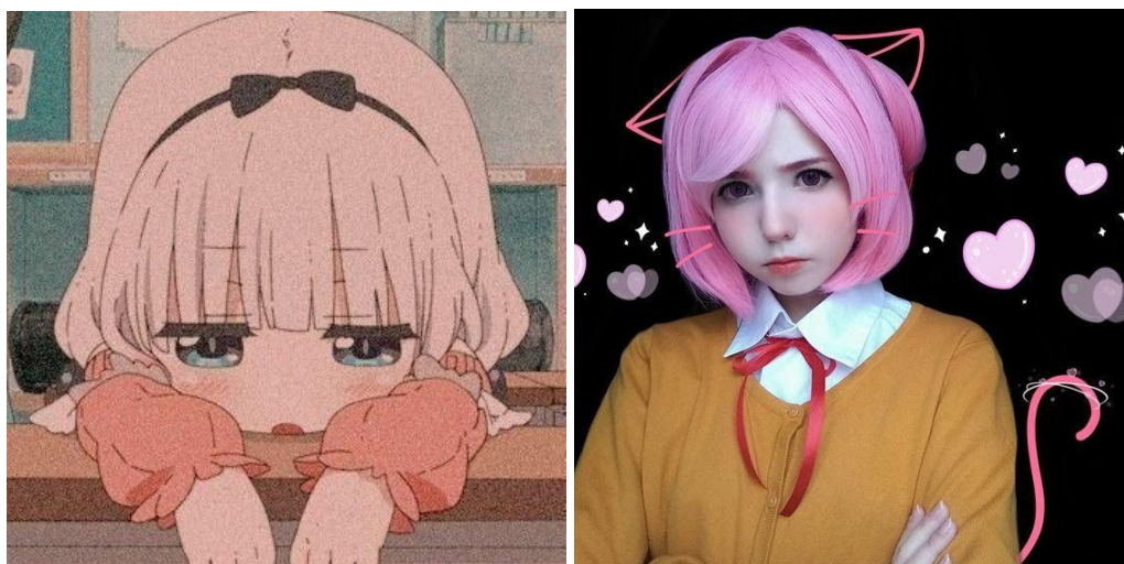
Figura 10.1 e 10.2 - Estética Loli , no anime e a na vida real, respectivamente