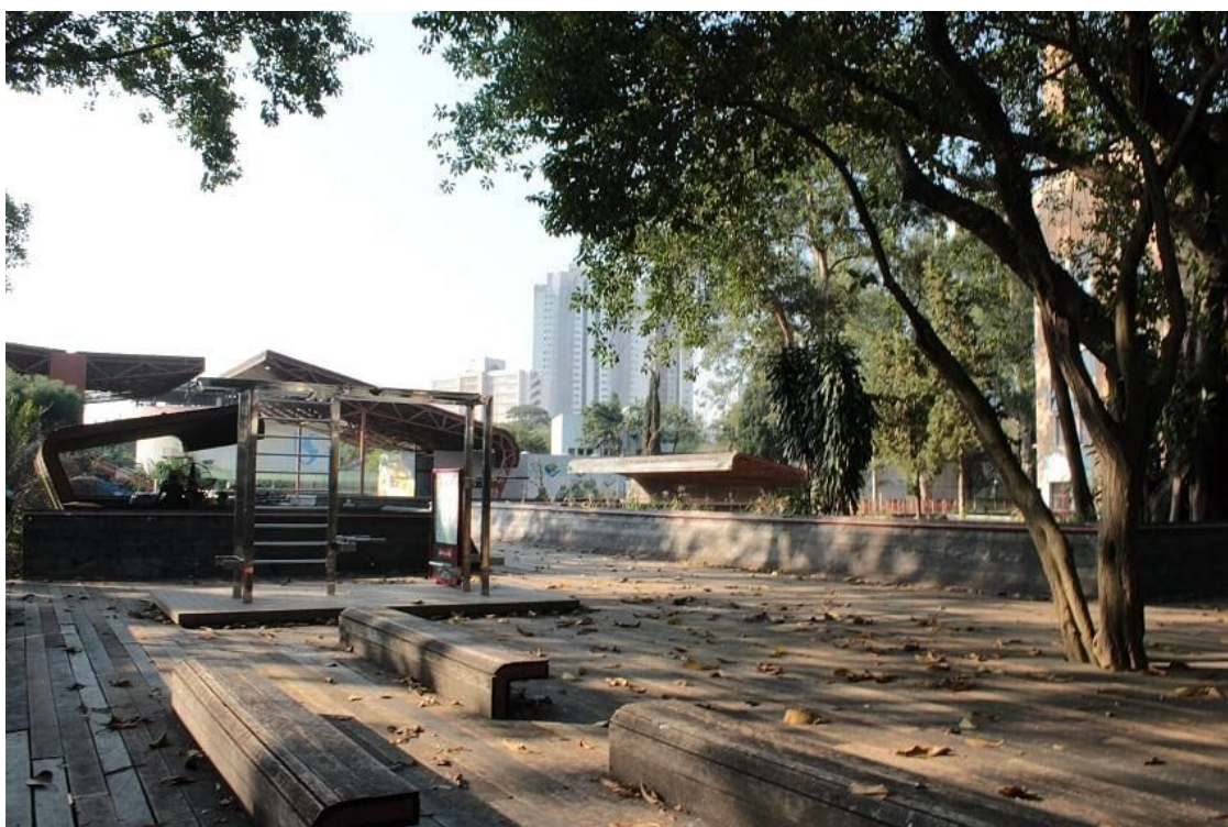
Figura 13 - Praça Victor Civita em Pinheiros

Podemos perceber, então, que a liberdade de expressão não comportava todas as formas de opinião e suprimia principalmente os jovens pobres que não conseguiam sair do seu bairro. Apesar de estarmos falando sobre as praças, isso acabava ocorrendo sobretudo nos espaços privados ou público-privados, onde aquele grupo era visto como transgressor e perigoso aos olhos do status quo da sociedade.