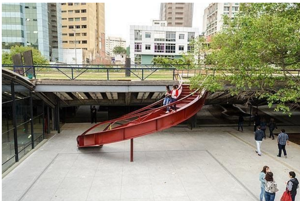
Figura 7 - Centro Cultural São Paulo

Além disso, o prédio oferece o projeto “Centro do Rock” que consiste na entrada franca em shows de rock para os interessados e apresenta também um espaço amigável para grupos de prática de street dance, independente do modelo da dança. Apesar de muitos dançarinos e dançarinas usufruírem do espaço, é visível a preferência dos “kpopers” - fãs do gênero k-pop - na ocupação das áreas cobertas do Centro Cultural São Paulo, que acaba sendo, por vezes, relacionado ao movimento emocore, o que iremos falar no tópico seguinte.