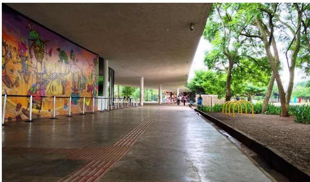
Figura 6 - Marquise do Parque Ibirapuera

Os parques municipais e estaduais foram locais onde a presença dos jovens emo ocorreu em massa. Dado suas grandes extensões, acabou acolhendo diversos eventos, que muito se assemelham aos posteriormente apelidados “rolezinhos” que ocorriam nos shoppings. No parque do Ibirapuera, por exemplo, muitos eventos ocorriam ao ar livre, como os “encontrões” dos emos que se concentravam principalmente na área da marquise.