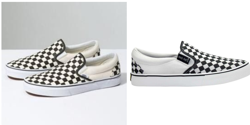
Figura 3.1 e 3.2 - Vans slip on e Mad Rats slip on, respectivamente