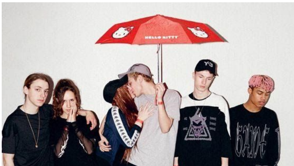
Figura 15 - Yung Lean e o grupo Sadboys