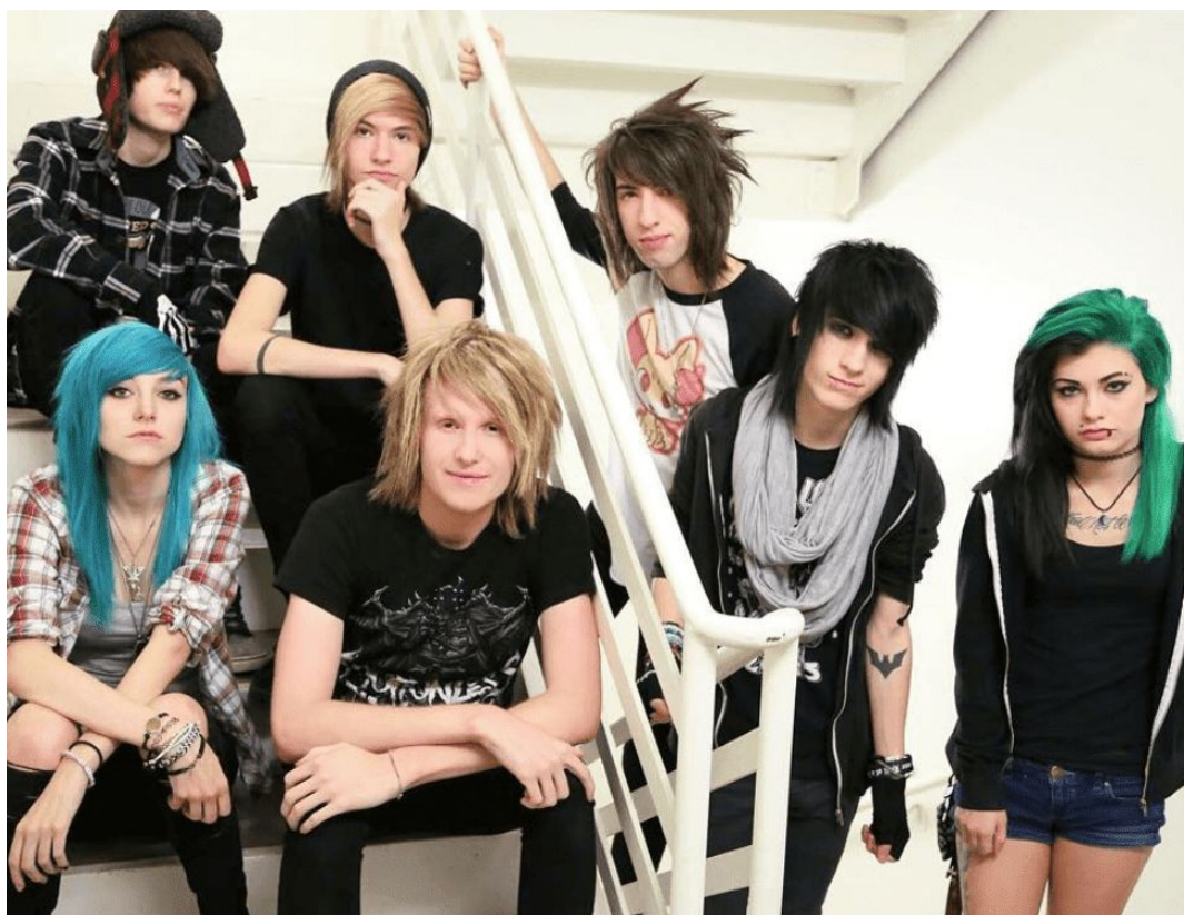
Figura 4 - Exemplo de scene kids

diferenças entre os dois, apresentando elementos mais coloridos em sua moda, tanto nas roupas e acessórios quanto no cabelo, que apesar de ter cortes que remetiam ao emo, eram mais repicados e rebeldes e em sua maioria das vezes possuía cores vibrantes com opções voltadas ao Neon.