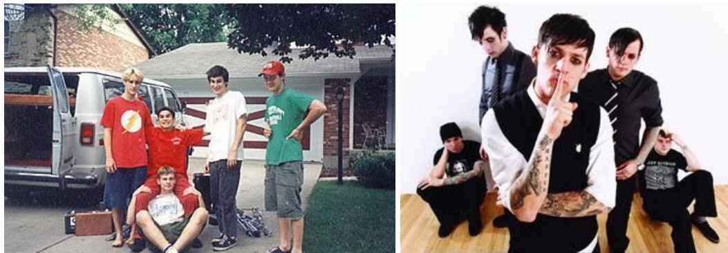
Figura 2.1 e 2.2 - Exemplos de Real emo (Cap' n Jazz) e Fake emo (Good Charlotte), respectivamente