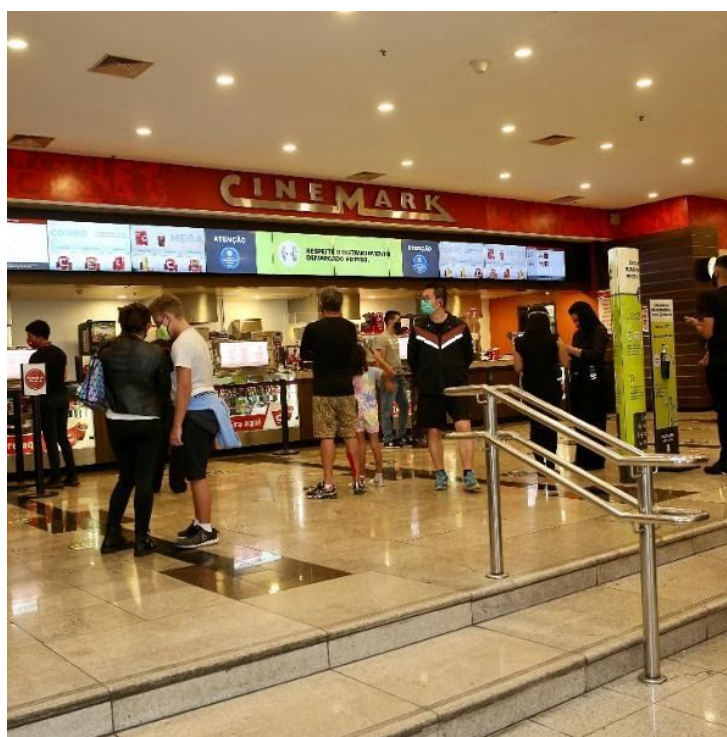
Figura 11 - Exemplo de cinema em shopping

Os jovens emo como consumidores da cultura pop e aficionados pelo romantismo eram grandes frequentadores de cinemas, principalmente nos shopping, onde a sua presença era quase garantida. Em alguns desses estabelecimentos havia promoções, como a “Quinta do Beijo”, que consistia em jovens beijando seus pares a fim de conseguir o desconto no bilhete de entrada dos filmes. Apesar de não ser específico para os emos, eram eventos muito comuns entre a comunidade e, dessa forma, podemos compreender que “o lugar é necessariamente constituído a partir da experiência que temos do mundo” (TUAN, 1975).