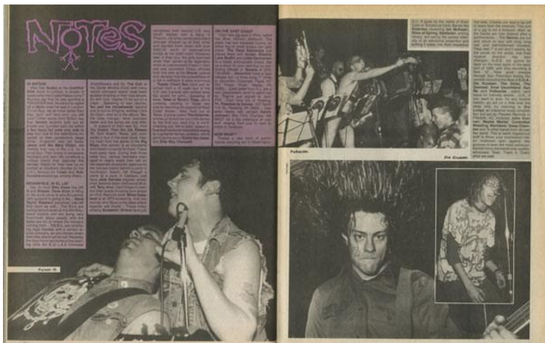
Figura 1 - Primeira aparição do termo emo