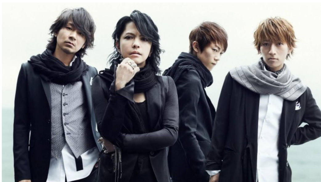
Figura 9 - Banda japonesa L'arc-en-ciel