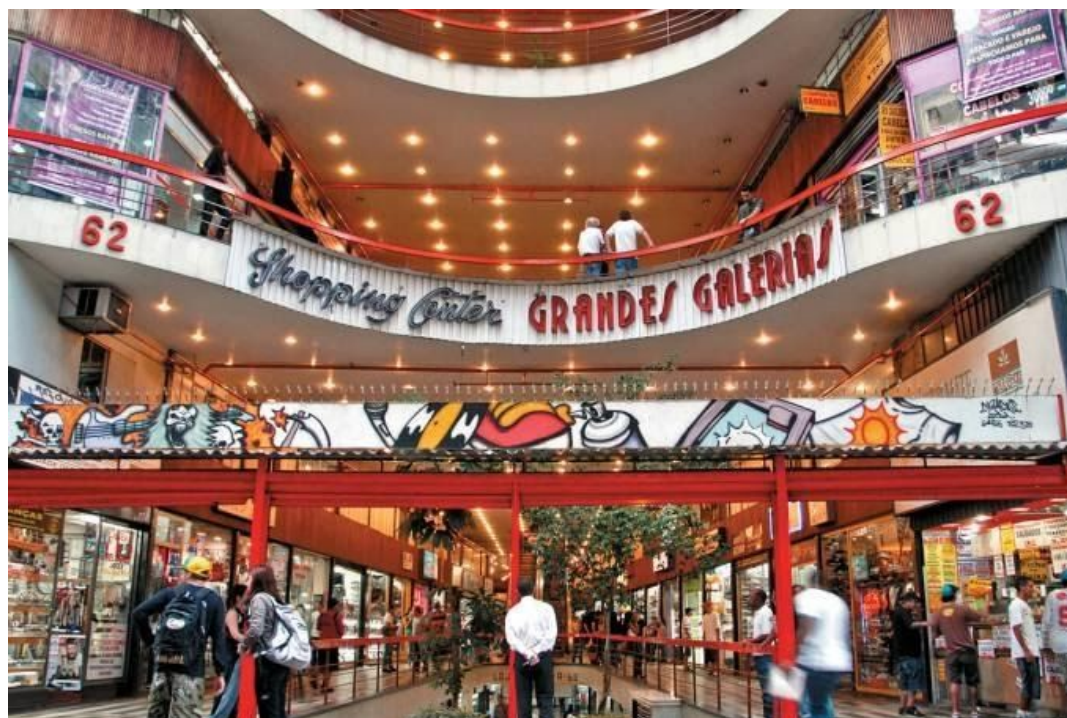
Figura 5 - Galeria do rock

grafites, skate, estúdios de tatuagem, lanchonetes, estamparias e conta com uma grande variedade de comércio de calçados.