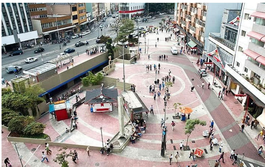
Figura 8 - Praça da Liberdade em São Paulo

Essa praça muito é lembrada pela centralidade do bairro que leva o mesmo nome, local onde pessoas de diferentes tribos urbanas utilizam como ponto de encontro e de partida ou, até mesmo, como o próprio lugar de reunião social. Ao andar pela praça, era possível ver muitos membros do movimento emo sentados nas escadarias de saída da estação de metrô, alguns se utilizando de narcóticos, álcool, cigarro, ou de nenhuma substância enquanto conversavam e se divertiam uns com os outros.