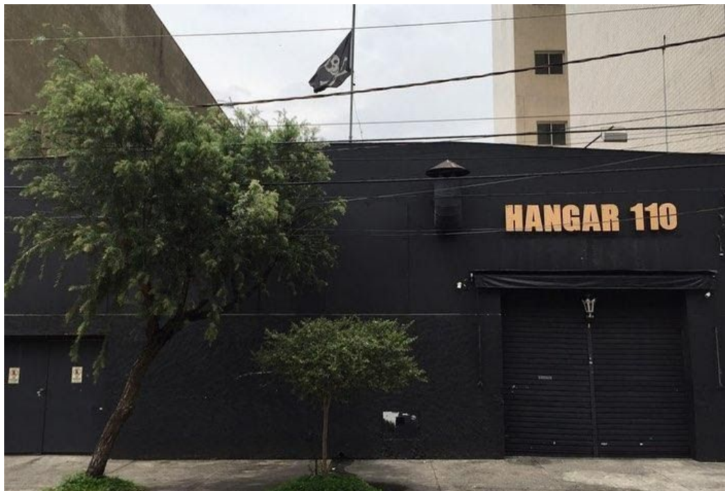
Figura 12 - Hangar 110

Dessa forma, quando algum indivíduo fora dos movimentos presentes entravam em contato com o local era possível perceber que “existe um evidente contraste entre aquele que percebe como visitante, que observa - que vê a cena superficialmente - e aquele que está 'em casa' e que experimenta o lugar.” (POCOCK, 1981)