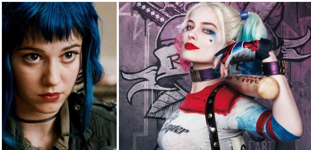
Figura 16.1 e 16.2 - Mary Elizabeth Winstead e Margot Robbie, respectivamente como Ramona Flowers e Arlequina