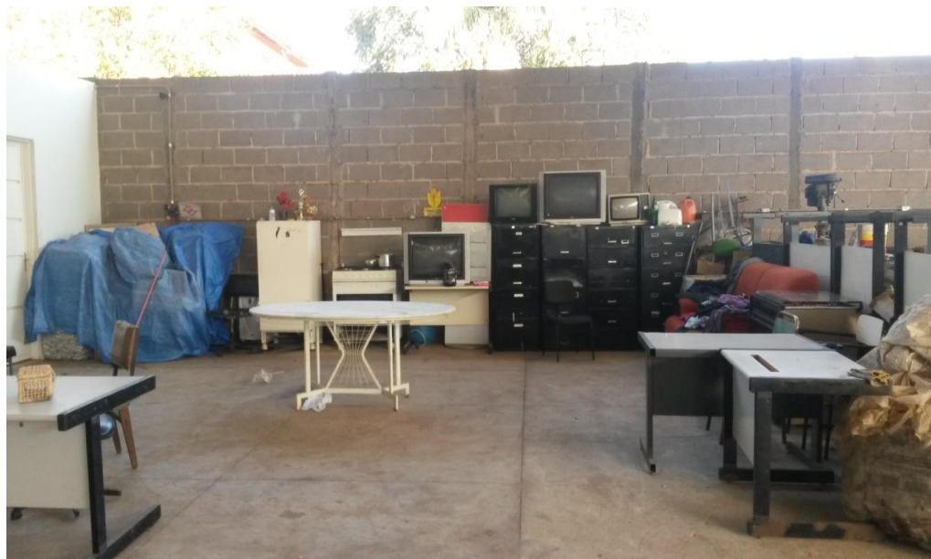
Figura 5: Local utilizado para as refeições

O grupo mostrou-se unido, todos ressaltaram tal aspecto em suas respostas.