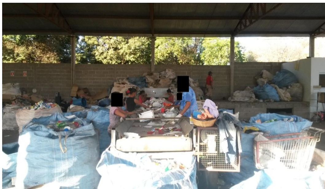
Figura 3: Catadores na esteira de separação do material já coletado

As perguntas foram divididas em três tópicos: 1) Perfil dos associados, para que fosse possível conhecer os catadores de forma individualizada; 2) Trabalho, com intuito de conhecer quais são as condições que os catadores trabalham; 3) Associação, em razão da necessidade de saber como funciona a associação dos catadores do Município de Batatais.