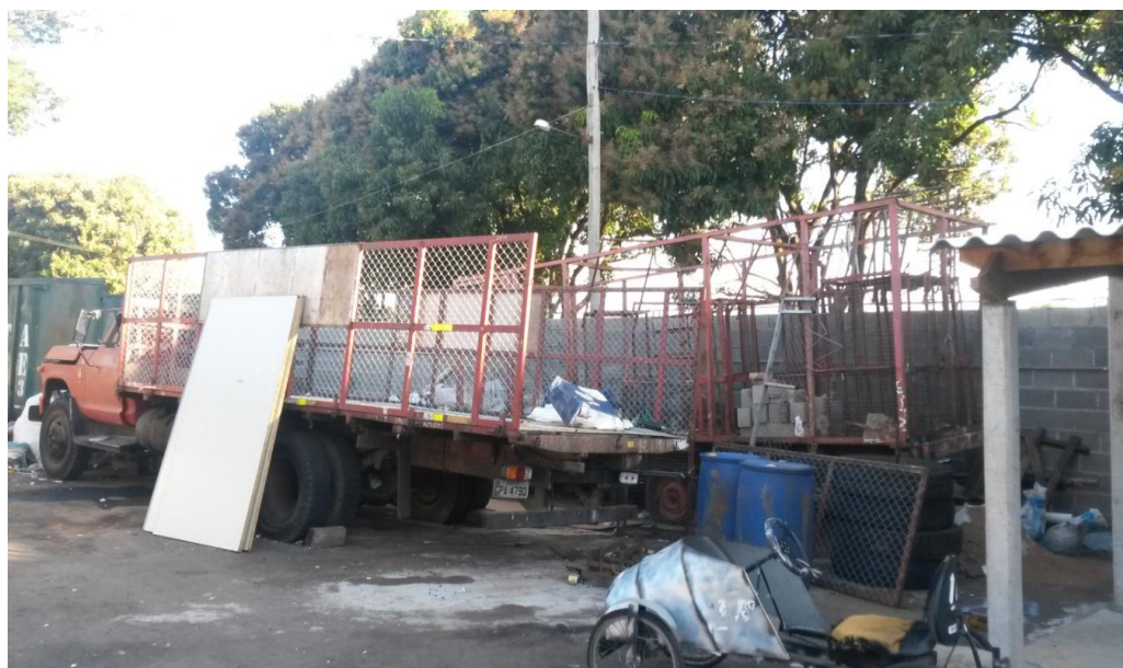
Figura 4: Caminhão utilizado na coleta do material

Os catadores trabalham das sete horas da manhã às dezessete horas.