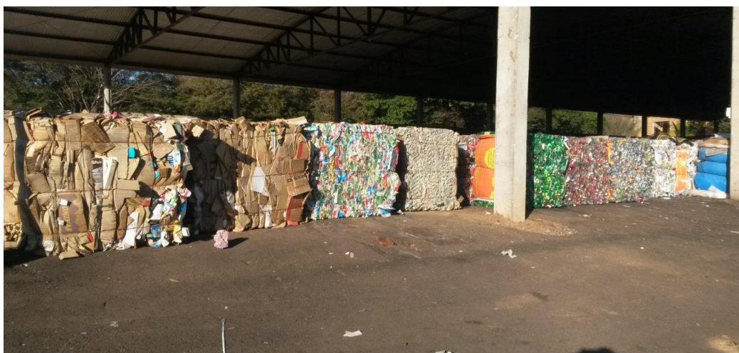
Figura 2: Materiais prensados e separados por cores

Os materiais são separados conforme o tipo - papel, plástico, vidro – assim como por cores, o que agrega maior valor aos produtos.