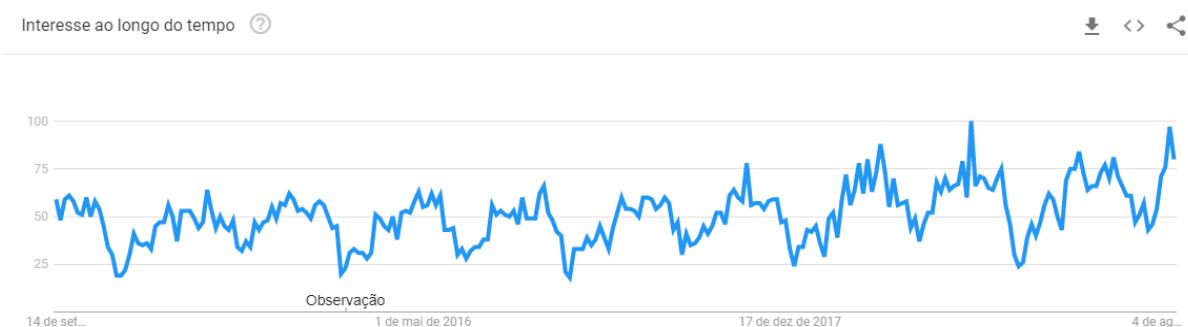
Figura 1 - Buscas ao longo do tempo pelo termo “saúde mental”

Ao longo dos últimos anos, é possível falar que a saúde mental ganhou força em meio ao debate público, como pode ser evidenciado por meio do aumento das pesquisas pelo termo “saúde mental” na plataforma de pesquisa do Google nos últimos cinco anos no Brasil (imagem 2.1); estudos internacionais que discutem a ligação entre o cotidiano da sociedade e efeitos na saúde mental, como no caso das redes sociais (BBC, 2017) e; por último, o interesse por causas como o Setembro Amarelo, uma campanha de conscientização sobre a prevenção do suicídio no mês do Dia Mundial de Prevenção do Suicídio (10 de setembro), criado em 2015 pelo CVV (Centro de Valorização da Vida), CFM (Conselho Federal de Medicina) e ABP (Associação Brasileira de Psiquiatria) (SETEMBRO AMARELO, 2019).